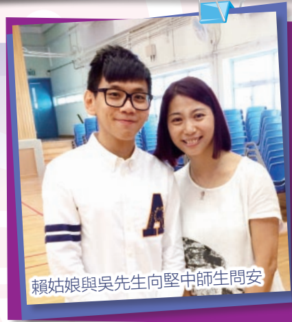
賴姑娘與吳先生向堅中師生問安