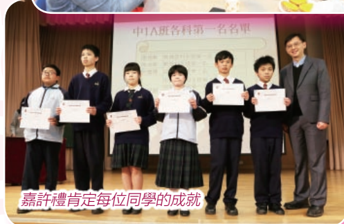
嘉許禮肯定每位同學的成就