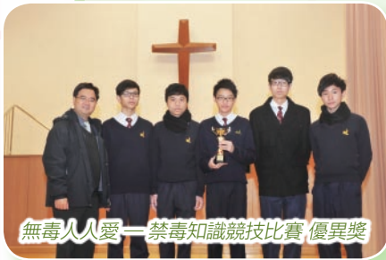
無毒人人愛—禁毒知識競技比賽 優異獎

本年度學校致力優化現行學與教的制度，如重新編寫了成績表評語、語文科在成績表上分項記錄分數，使成績表更清楚反映學生的學習表現。此外本校亦成功得到由香港考試及評核局發出的優質評核管理認證，肯定了本校的考評工作。在未來的日子，校方會繼續優化試升制度、功課政策、註冊機制等，以幫助同學學習成長。