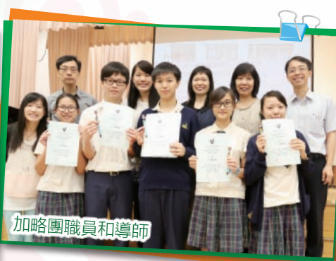
加略團職員和導師