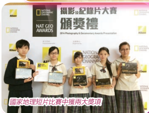
國家地理短片比賽中獲兩大獎項