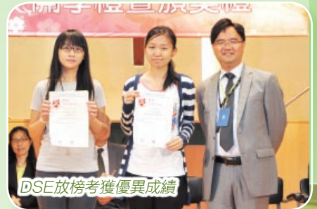
DSE放榜考獲優異成績

學校相信學生學習和老師教學是相輔相成的，學生養成良好的學習習慣，非一朝一夕可以達至，因此多年前已開始在初中培養學生的學習習慣，至今略見成效。如同學已漸漸習慣在課堂上抄寫筆記、掌握有效溫習方法等等。同學上課的坐姿、留心學習的態度，除了給來訪者(包括大學教授、教育局的官員、友校老師等)留下深刻的印象外，具體的成果更在公開考試成績、校外比賽獎項中反映出來。今年的中學文憑試，約有40位同學獲大學學位課程取錄，當中不少同學在應考科目中獲得5級、5*或5**的成績。在其他全港性的學術比賽方面，同學亦取得可喜的成績：如獲取了哈佛圖書獎、澳洲國際學科評估試科學科獎項、港澳盃數學奧林匹克賽獎項、澳洲皇家化學學院國家級化學測試獎項、全港校際經濟辯論比賽獎