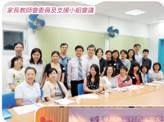
家長教師會委員及支援小組會議

本校家長透過家長教師會與學校合作，努力為學生營造良好學習環境，包括設立獎學金、參與獎學金遴選、課室清潔和班際壁報比賽評分及試食遴選飯盒供應商等。校友亦透過「學長計劃」及短講分享經驗，設立獎學金關心和支援在校的師弟妹的學習。