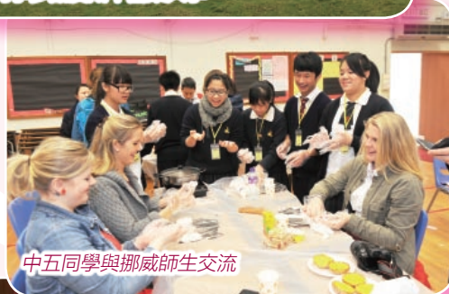
中五同學與挪威師生交流