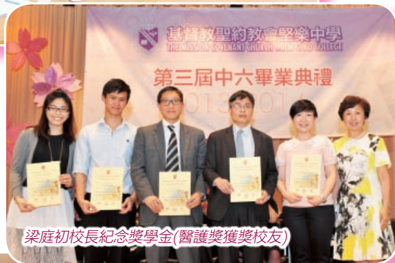
梁庭初校長紀念獎學金(醫護獎獲獎校友)