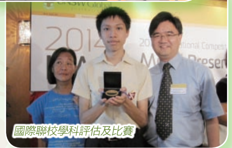
國際聯校學科評估及比賽

項、微軟少年程式設計比賽獎項等等。校方相信大部分同學已循一條正確的學習路向發展，假以時日，定必有更可觀的成績。