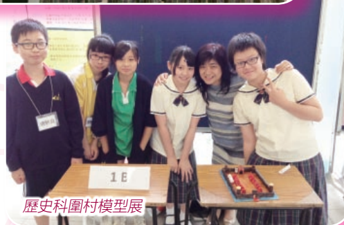
歷史科圍村模型展