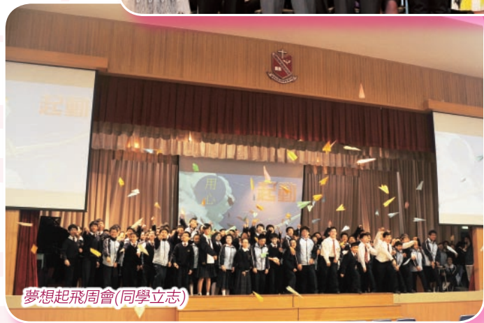
夢想起飛周會(同學立志)