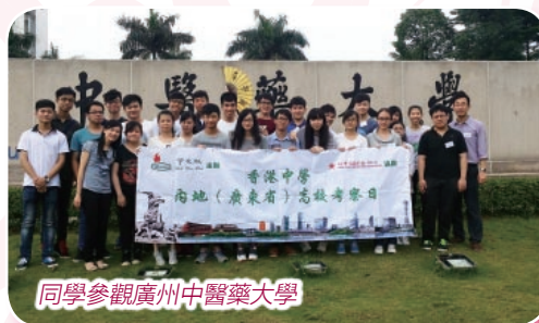
同學參觀廣州中醫藥大學

語文方面，另有60多位同學在校際英文朗誦比賽取得優異獎狀，本校辯論隊於第九屆全港校際經濟辯論比賽獲季軍……等等，獎項不能一一盡錄，成績確實令人鼓舞。