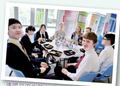
德國交流生和本校同學與挪威學生交流