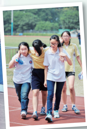
服務同學——紅十字會