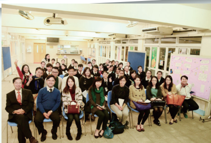
校友支援——「學長計劃」