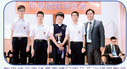
數學精英邀請賽團體冠軍及亞洲國際數學 奧林匹克公開賽榮譽證書個人獎