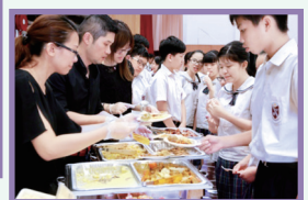
試食（選擇飯盒供應商）