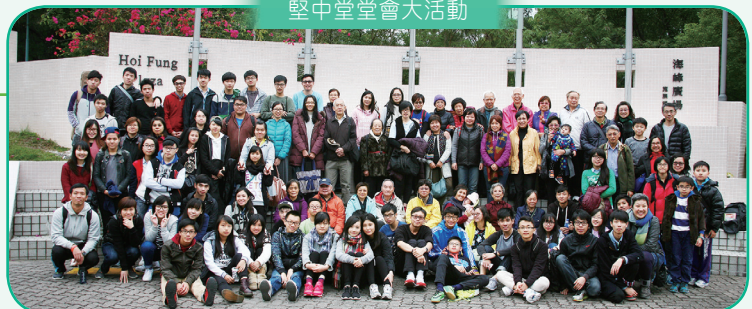
堅中堂堂會大活動