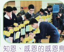
知恩、感恩的感恩鳥