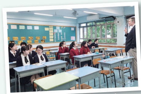
韓國韓東大學教授到校向學生講解韓國升學機會

為促進學生在日常生活中更多使用英語，本校參加AFS國際文化交流計劃。本年有一位德國交流生到本校4E班，與同學一起上課、學習和生活，大大增加了同學們使用英語的機會。此外，學校繼續優化初中推行的跨學科語文課程(Language Across Curriculum - LAC)，把科學和地理的課題引入英文課程中，提升學生學習英語的興趣和應用知識的機會。承接往年經驗，本校第二年組織英語辯論隊，學生表現非凡，分別在2014年11日及2015年5月取得九龍區及九龍東區聯校英語辯論比賽冠軍。此外，學校積極推行不同的英語活動，讓學生在多元化的語境學習英語，校際英語朗誦比賽、班際英語朗誦比賽、挪威師生交流、Science is FUN、英語地理考察等活動，都在不同層面營造學校的英語學習環境。