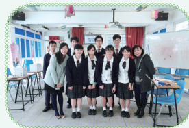
朋輩調解員訓練計劃