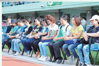
家長參與——陸運會閉幕禮