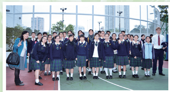
4E同學獲校際英詩朗誦季軍