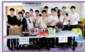
水果日（午間鬆一鬆）