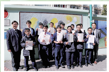
數學比賽得獎學生