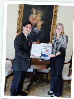
校長加拿大升學考察及締結升學盟約

為了讓學生從小開始為自己的定下成長目標，本校推行了生涯規劃，透過學生成長概覽、升學就業講座、職場參觀等，讓學生建立自己的發展方向。本年度，學校為每位中三和中五同學組織了個人升學與就業輔導計劃，老師透過小組活動和個別面談，協助同學認識自己，計劃未來升學與就業的方向。本年，學校加強商校合作計劃，為同學舉辦了多個職場參觀活動，有國泰城、香港電台、明報、消防局等等，讓學生認識本地的大型機構的運作模式和工作團隊的不同職能，啟發學生未來發展的路向。