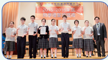
香港數理學會主辦——科學評核測試賽 獲獎學生