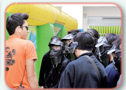
活動中建立團隊合作