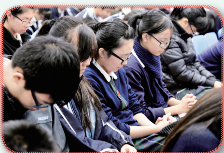
以心靈與上帝交談