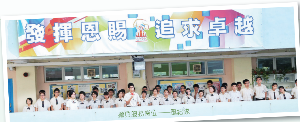
擔負服務崗位——風紀隊

支援學生成長方面，家長及校友的支援至為重要。本校家長透過家長教師會積極參與學生事務，共同幫助學生健康成長，包括設立獎學金、參與獎學金遴選、課室清潔和班際壁報比賽評分及試食遴選飯盒供應商等。校友亦關心和支援在校師弟妹的學習，除了設立獎學金外，更透過「學長計劃」分享在職場的經驗，學生獲益良多。