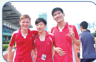
德國交換生與堅樂學生共融

我校同學在學習中得到多元的發展，提高了學習的效益。數學科方面，我校同學本年在各大比賽獲獎無數，更有同學於國際數學競賽中獲獎。中、英文科於校際朗誦奪得多項獎狀，英艾科更於教育局主辦的英語創作比賽屢獲獎項。另外，本校今年更開展了英文辯論隊，同學不斷突破自己，戰勝強敵，取得九龍區聯校比賽的冠軍，與中文辯論比賽並駕齊驅。至於科學科的水火箭活動、生物科的奧林匹克比賽、中文科的寫作比賽及通識科的公民話劇、名人講座等，均使同學擴闊視野，獲益良多。