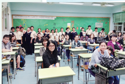
家校合作——家長晚會