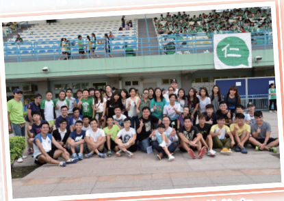
陸運會回校為師生打氣的校友