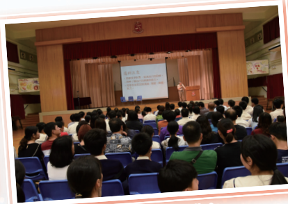
家長晚會選科講座