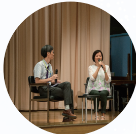
中一新生家長日：家長分享