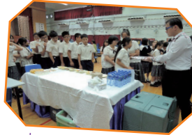
中一及中二留校午膳計劃午餐試食會