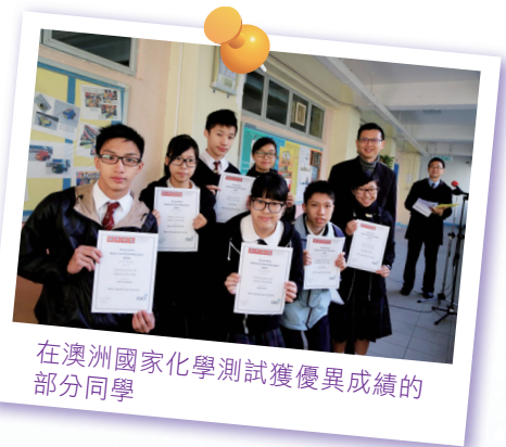
在澳洲國家化學測試獲優異成績的部分同學

支援。學生對流動裝置的認識，課堂跨組交流互動學習，以及反轉教室的影片預習，均促進學生建立更佳的學習習慣。