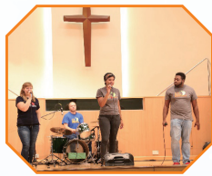
青年歸主福音聚會