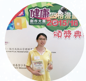
健康四格漫畫創作大賽亞軍

學生與教師的學習群體建立，提昇了學生在學業與活動的表現。本年，學生在中學文憑試成績穩步上揚，中文及英文科合格率、獲升讀大學及大專資格比率及JUPAS獲派學士學位的比率位均創歷年新高，是師生們共同努力的成果。