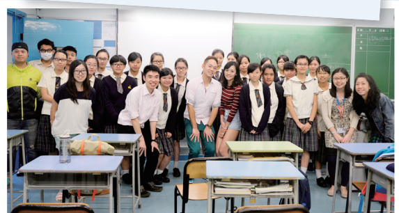
空中服務員分享會