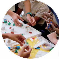
歷史科班際模型比賽

此外，學校本年開始引入電子學習 e-learning，以推動學生自主學習。電腦科、科學科及數學科率先參與計劃，並透過香港大學的校本支援計劃和優質教育基金的資助，增強電子學習的資源和