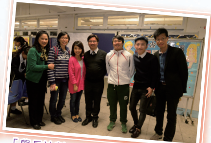
「學長計劃」：來自不同行業的校友