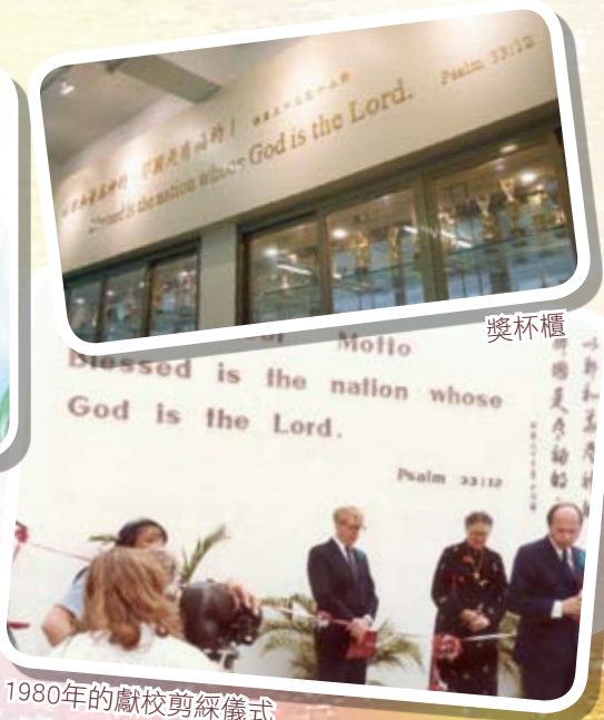
1980年的獻校剪綵儀式