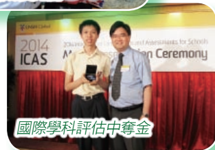
國際學科評估中奪金