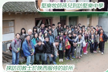
探訪司教士於陝西服侍的診所