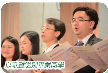
以歌聲送別畢業同學