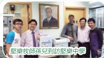
堅樂牧師孫兒到訪堅樂中學