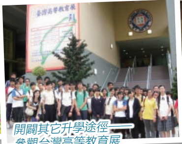
開闢其它升學途徑 參觀台灣高等教育展