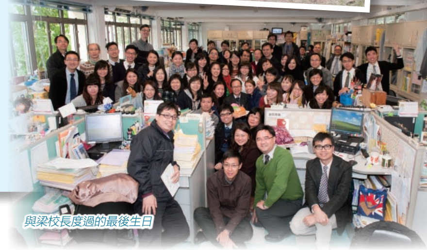
與梁校長度過的最後生日