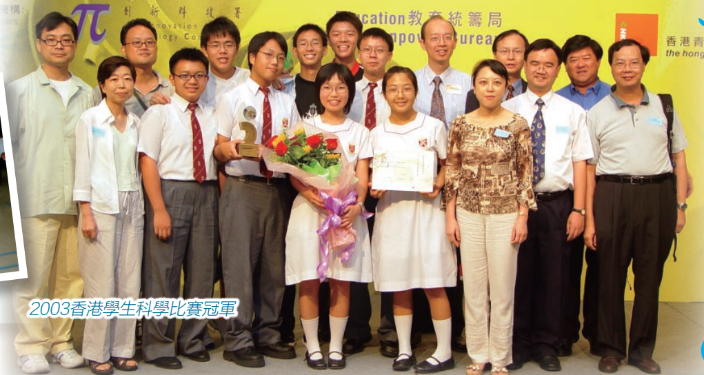
2003香港學生科學比賽冠軍