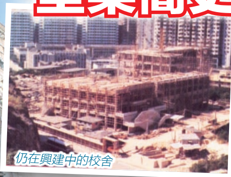
仍在興建中的校舍