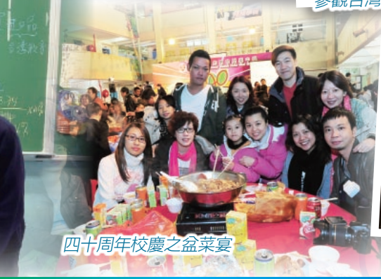
四十周年校慶之盆菜宴