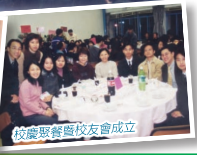
校慶聚餐暨校友會成立