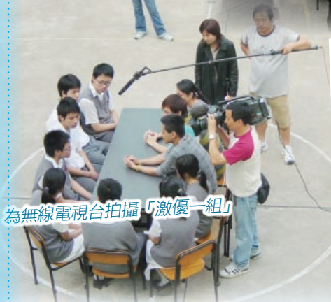
為無線電視台拍攝「激優一組」