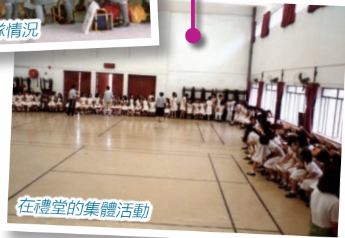
在禮堂的集體活動