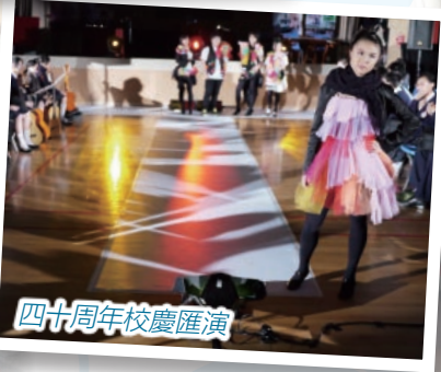
四十周年校慶匯演