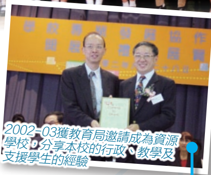
2002-03獲教育局邀請成為資源學校，分享本校的行政、教學及支援學生的經驗