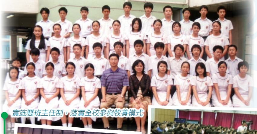
實施雙班主任制，落實全校參與牧養模式