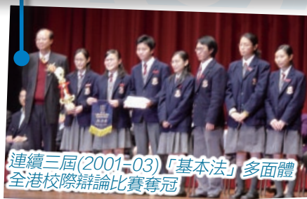
連續三屆(2001-03)「基本法」多面體全港校際辯論比賽奪冠