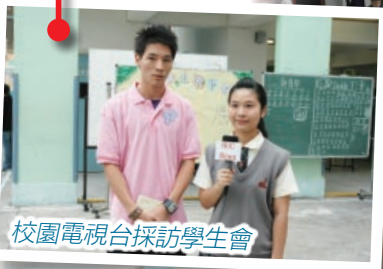
校園電視台採訪學生會