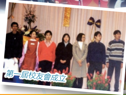
第一屆校友會成立