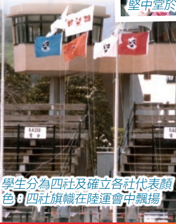
學生分為四社及確立各社代表顏色；四社旗幟在陸運會中飄揚