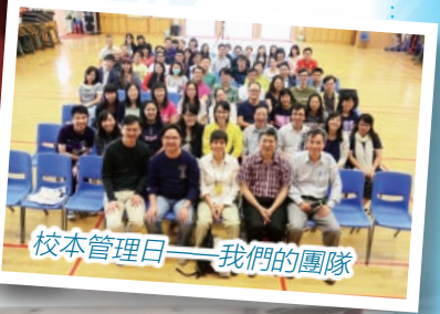
校本管理日——我們的團隊