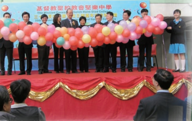
35周年校慶開放日暨嘉年華開幕禮