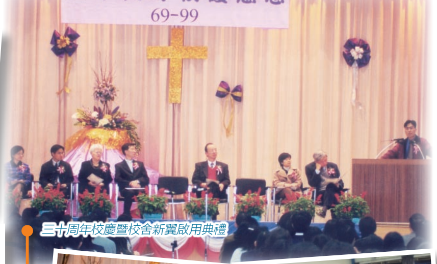
三十周年校慶暨校舍新翼啟用典禮