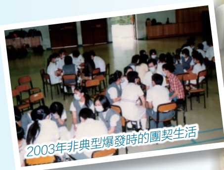
2003年非典型爆發時的團契生活