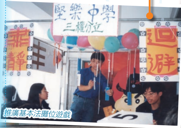
推廣基本法攤位遊戲