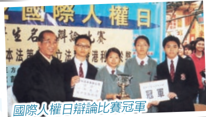
國際人權日辯論比賽冠軍