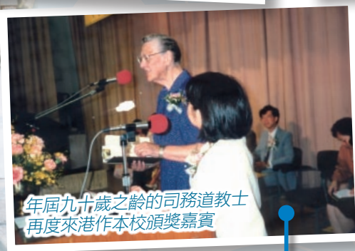
年屆九十歲之齡的司務道教士再度來港作本校頒獎嘉賓