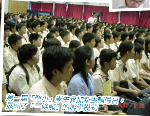
第一屆「堅小」學生參加新生輔導日，展開了「一條龍」的辦學模式