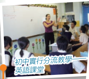
初中實行分流教學 英語課堂