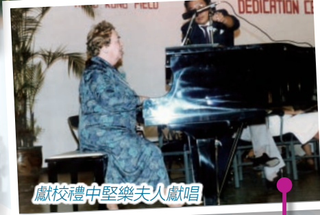
獻校禮中堅樂夫人獻唱