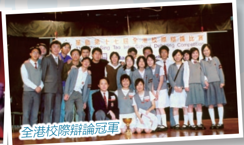
全港校際辯論冠軍