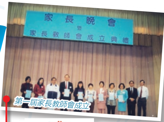
第一屆家長教師會成立