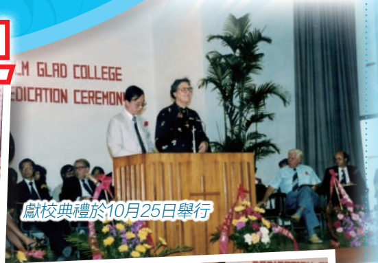
獻校典禮於10月25日舉行