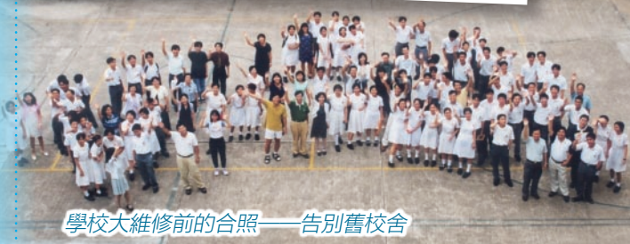
學校大維修前的合照——告別舊校舍