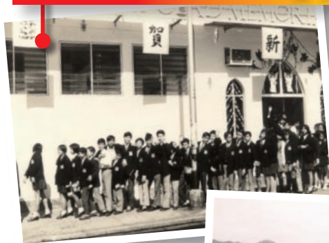
學生於街上排隊上課