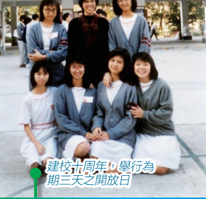
建校十周年，舉行為期三天之開放日