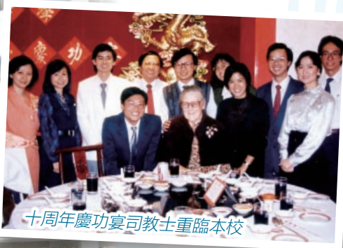
十周年慶功宴司教士重臨本校