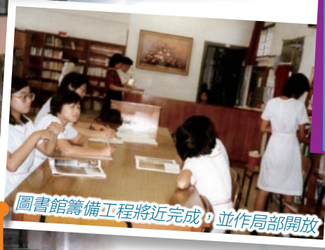
圖書館籌備工程將近完成，並作局部開放