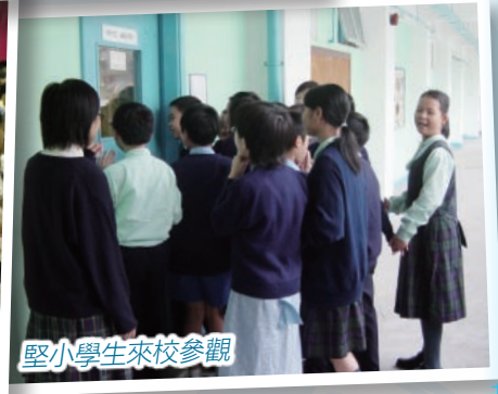
堅小學生來校參觀