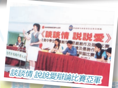
談談情 說說愛辯論比賽亞軍