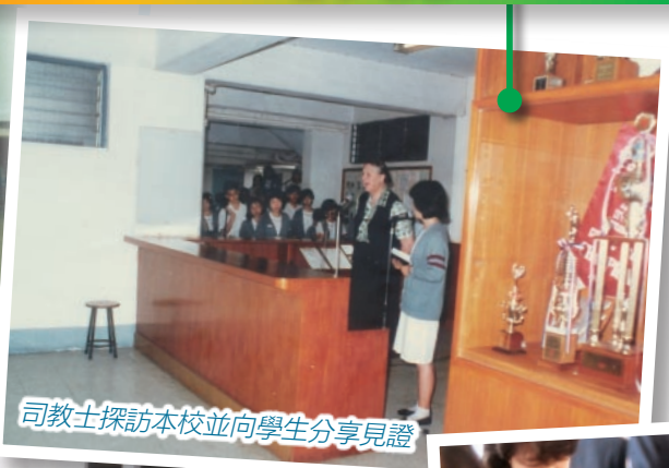
司教士探訪本校並向學生分享見證