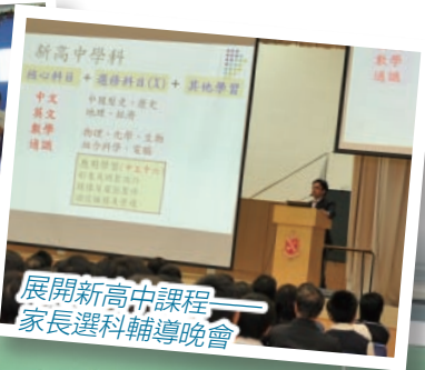
展開新高中課程 家長選科輔導晚會