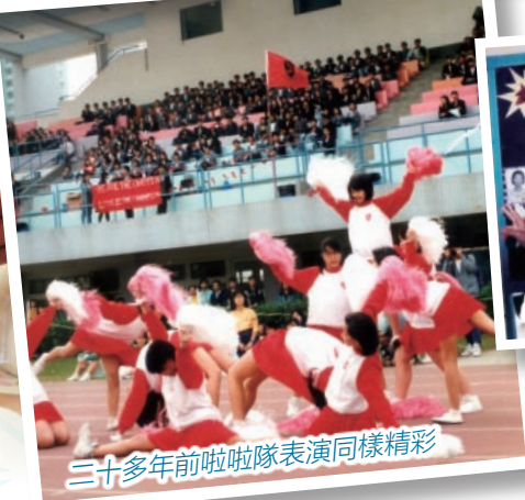
三十多年前啦啦隊表演同樣精彩