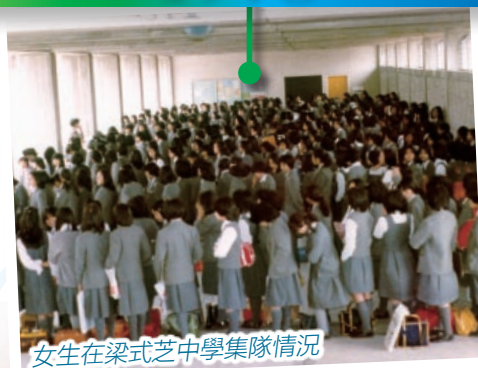
女生在梁式芝中學集隊情況