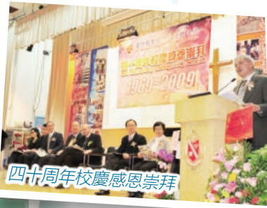
四十周年校慶感恩崇拜