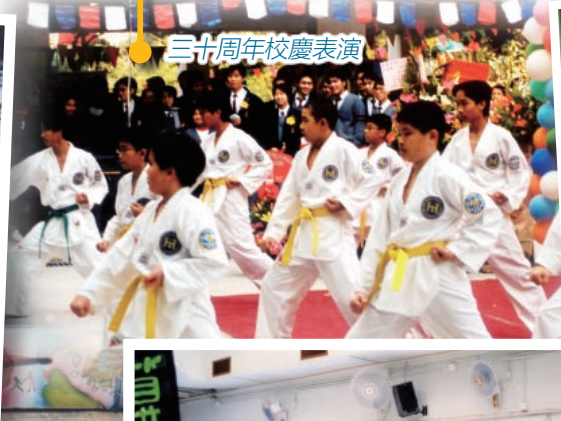
三十周年校慶表演