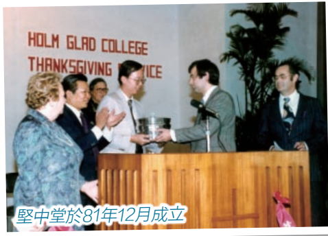
聖中堂於81年12月成立