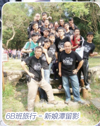
6B班旅行 - 新娘潭留影