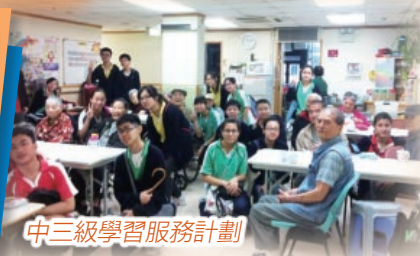
中三級學習服務計劃