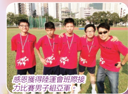
感恩獲得陸運會班際接力比賽男子組亞軍。