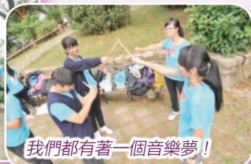
我們都有著一個音樂夢!