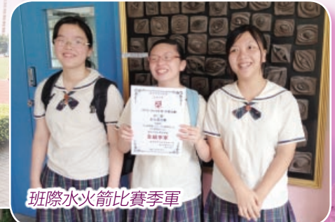
班際水火箭比賽季軍