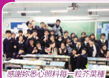
感謝妳悉心照料每一粒芥菜種