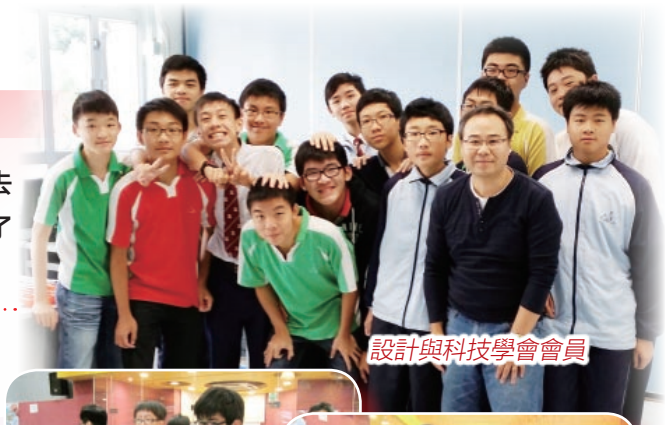
設計與科技學會會員

曾參與比賽 2013奧林匹克足球機械人比賽 獲獎記錄 世界奧林匹克機械人競賽(WRO)2013香港區 足球機械人選拔賽 一等獎及二等獎