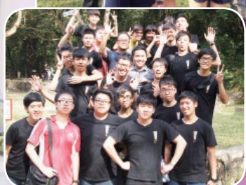
中六旅行日-何太呢？