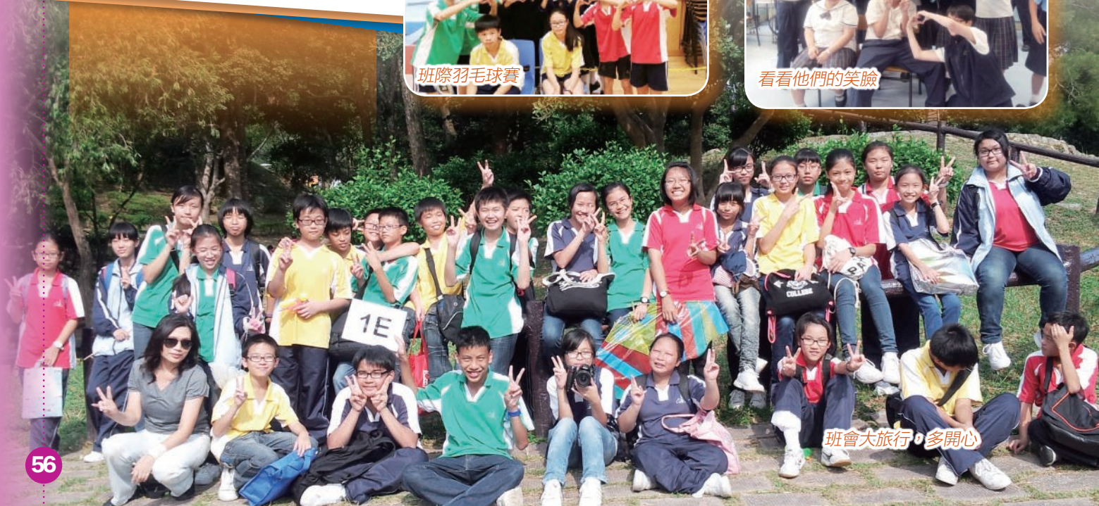
班會大旅行，多開心