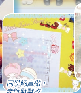
同學認真做，老師默默改