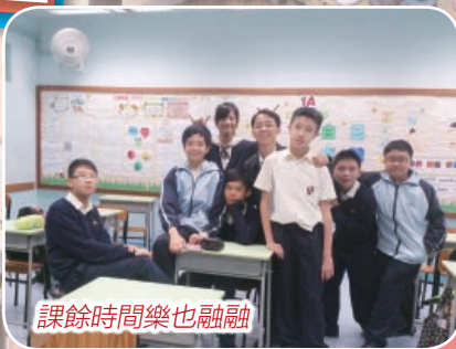
課餘時間樂也融融