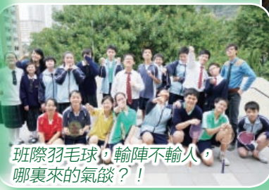
班際羽毛球，輸陣不輸人，哪裏來的氣燄？！