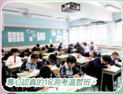
專心認真的1C測考溫習班。