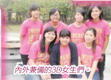
內外兼備的3D女生們。