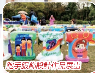
跑手服飾設計作品展出

曾參與比賽 馬拉松101「跑出創意」大行動－跑手服飾設計比賽 全年活動 熱燙膠珠、印章製作、漫畫筆袋設計、Cupcake吊飾創作