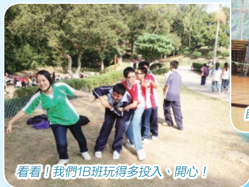
看看！我們1B班玩得多投入、開心！