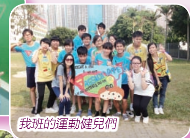
我班的運動健兒們