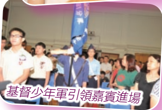
基督少年軍引領嘉賓進場