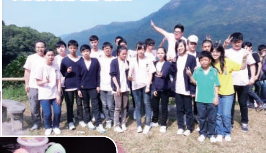
在旅行日當天的大合照