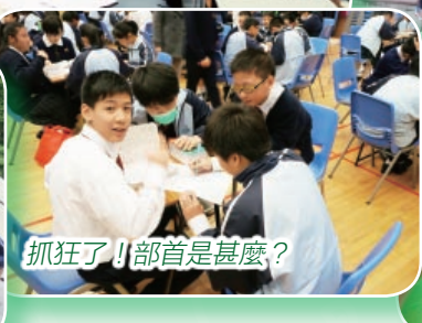
抓狂了！部首是甚麼？