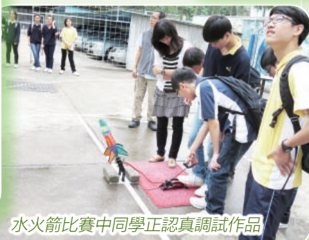
水火箭比賽中同學正認真調試作品