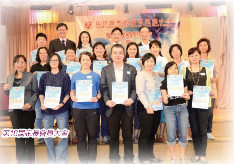
第18屆家長會員大會

本年度的工作能得以順利進行，實有賴各委員的努力及家長、老師的支持。今年亦嘗試提早推行家長校董代表的選舉，配合教育局校本措施及法團校董法案的發展，讓家長能有更大的空間表達意見。本校明年的目標為積極學習、拓展視野，盼望家長能與學校繼續合作給學生營造最佳的學習環境。