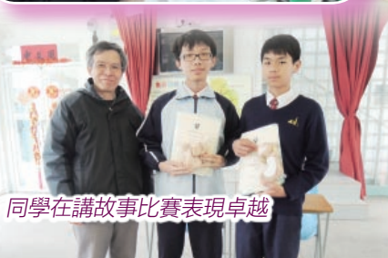
同學在講故事比賽表現卓越