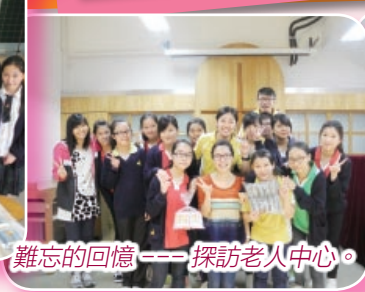
難忘的回憶——探訪老人中心。