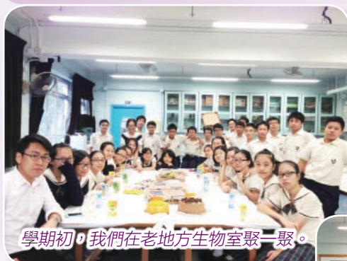
學期初，我們的老地方生物室聚一聚。