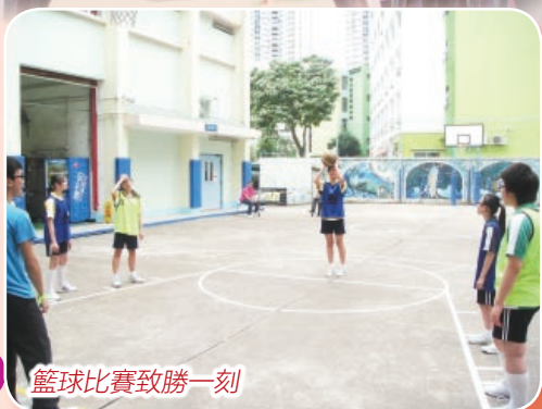
籃球比賽致勝一刻