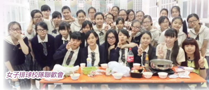
女子排球校隊聯歡會