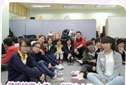
健康校園大使—「學生大使—跳躍生命」計劃