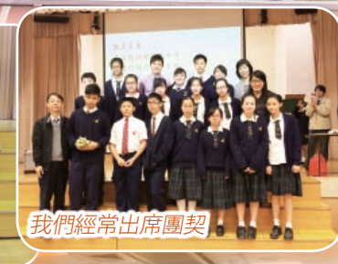
我們經常出席團契