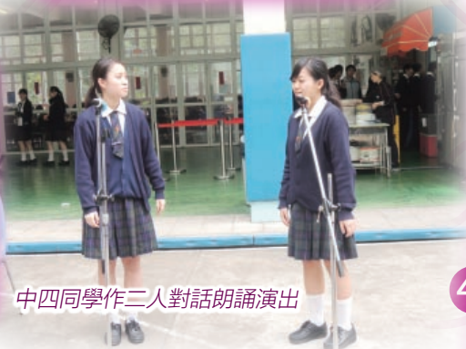
中四同學作三人對話朗誦演出