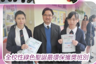
全校性綠色聖誕最環保獲獎班別