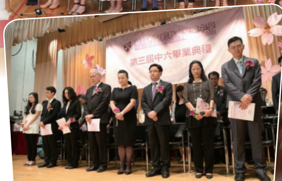
誠心祈禱，仰望天恩