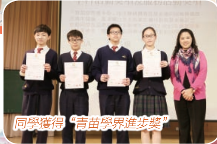
同學獲得“青苗學界進步獎”