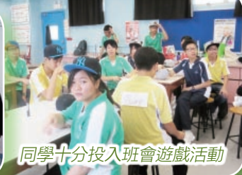
同學十分投入班會遊戲活動