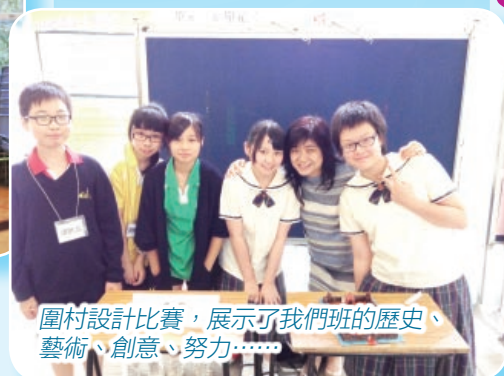
圍村設計比賽，展示了我們班的歷史、藝術、創意、努力……