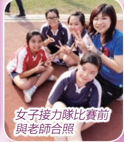
女子接力隊比賽前與老師合照