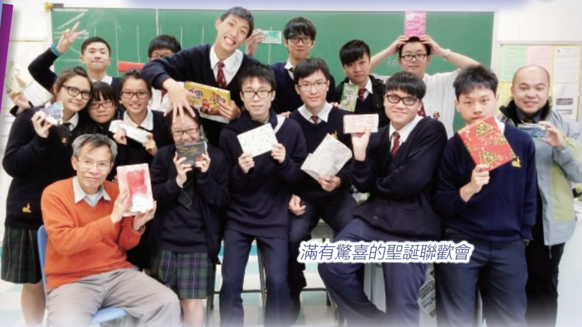
滿有驚喜的聖誕聯歡會