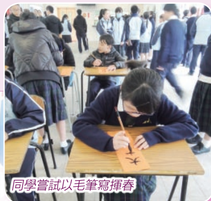
同學嘗試以毛筆寫揮春