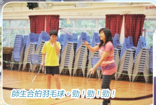
師生合拍羽毛球。勁！勁！勁！