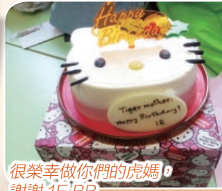
很榮幸做你們的虎媽， 謝謝 1E!BB