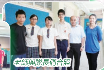
老師與隊長們合照