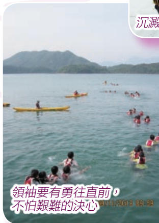
領袖要有勇往直前， 不怕艱難的決心