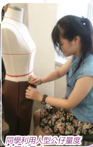
同學利用人型公仔量度衣服的尺寸