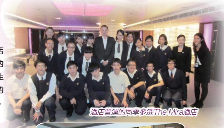
酒店營運的同學參選The Mira酒店

本課程旨在讓學生在模擬環境下，學習酒店營運的基礎知識和有關客務部、房務部及餐飲部的實務操作技能。透過多元化的教學活動，提升學生對旅遊業及酒店營運之興趣與認知，培養出良好的服務文化、自律及團隊精神，並加強他們的解難、溝通和表達能力。