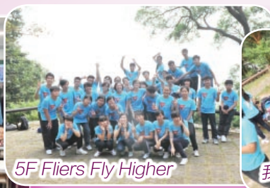
5F Fliers Fly Higher