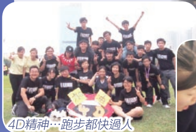
4D精神...跑步都快過人