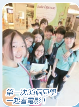
第一次33個同學 一起看電影!