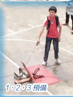
1, 2, 3 預備