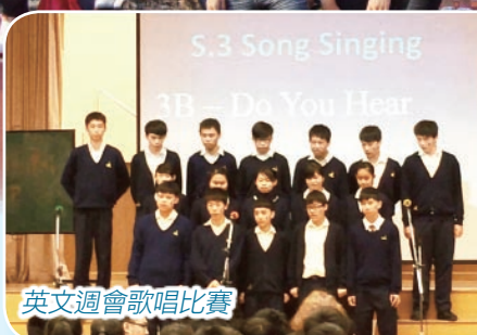
英文週會歌唱比賽