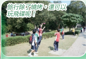
旅行除了燒烤，還可以玩飛碟呢！