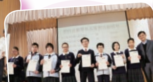
班級經營：好人好人計劃