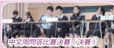
中文周問答比賽決賽（決賽）