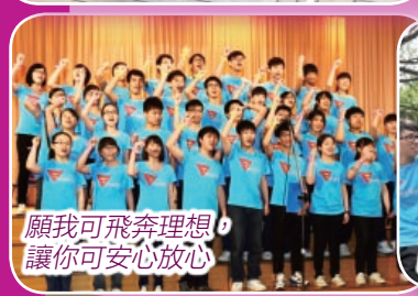
願我可飛奔理想， 讓你可安心放心