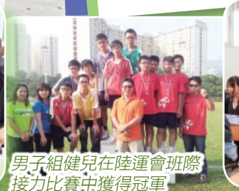
男子組健兒在陸運會班際接力比賽中獲得冠軍