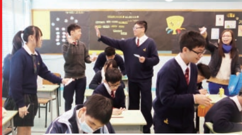
Give me Five. 我們中了Bingo!