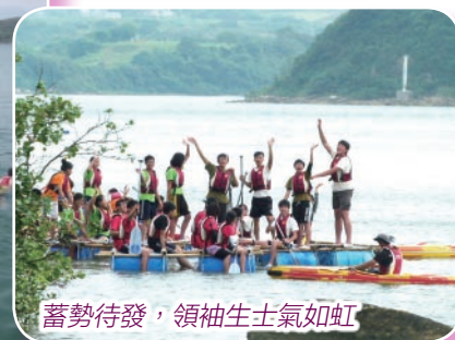
蓄勢待發，領袖生士氣如虹