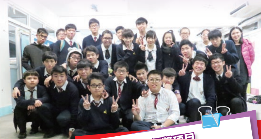
我們的完美句號 —真情對話