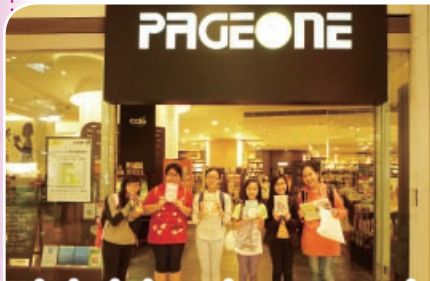
The Junior Ambassadors were very pleased with their selection of books from Page One bookshop at Kowloon Tong Festival Walk, intended for the school library after reading them and writing reports.