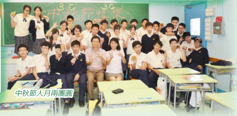
中秋節人月兩團圓