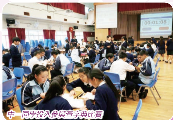
中一同學投入參與查字典比賽

今年中文周主題為【朋友之倫】，週內舉行了「徵文比賽」、「午間朗誦欣賞會」、「元宵活動」、「中一查字典比賽」、「中二講故事比賽」、「中三演講比賽」、「中文周問答比賽」等活動，同學們都積極參與。中文周的高潮莫過於在小禮堂的「元宵活動」，既有書展，亦有猜燈謎、繞口令、粵普對譯的攤位活動及毛筆書法活動，吸引大批同學參加，場面熱鬧。「中文周問答比賽」分為高、低年級兩組於禮堂進行，同學們須於一連串有關中文、文化及中史常識的問題中，爭取最高分數；除台上班代表同學參賽外，台下同學亦須參與，可謂眾志成城。