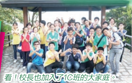
看！校長也加入了1C班的大家庭。