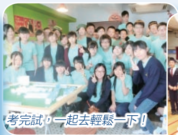
考完試，一起去輕鬆一下!