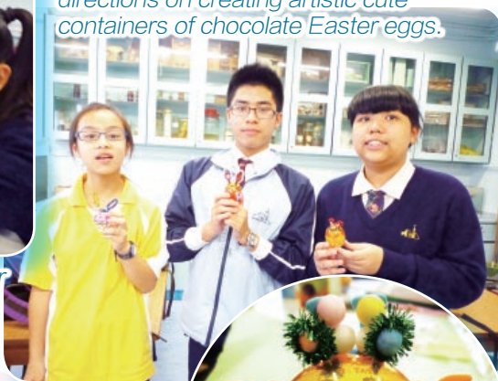
At Easter, students followed English directions on creating artistic cute containers of chocolate Easter eggs.