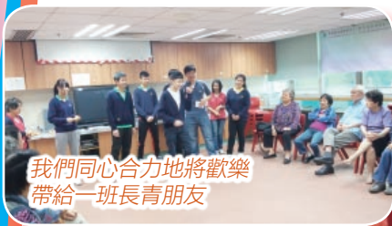
我們同心合力地將歡樂帶給一班長青朋友