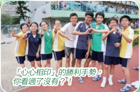
「心心相印」的勝利手勢，你看過了沒有？！