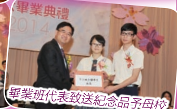
畢業班代表致送紀念品予母校