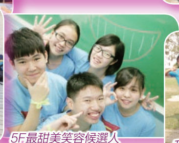
5F最甜美笑容候選人