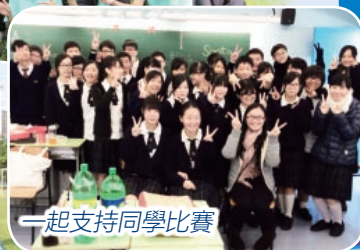
一起支持同學比賽