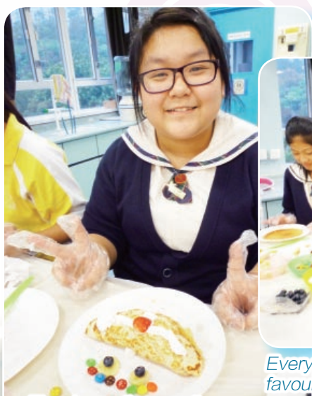
The decorations on the pancakes were all artistic and mouth watering.