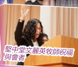
堅中堂文麗英牧師祝福與會者