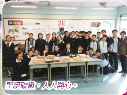
聖誕聯歡，人人開心。