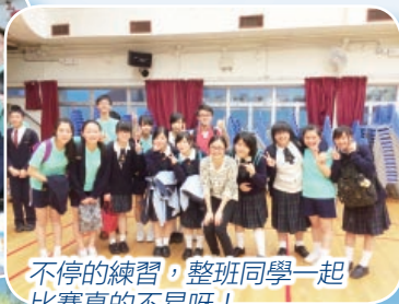
不停的練習，整班同學一起 比賽真的不易呀!