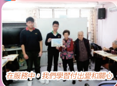
在服務中，我們學習付出愛和關心