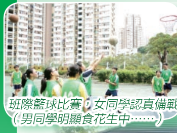
班際籃球比賽，女同學認真備戰！ (男同學明顯食花生中……)