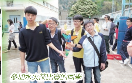
參加水火箭比賽的同學