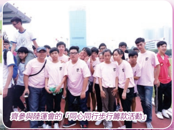
齊參與陸運會的「同心同行步行籌款活動」