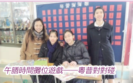
午膳時間攤位遊戲——粵普對對碰