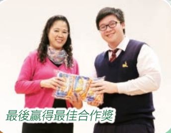
最後贏得最佳合作獎