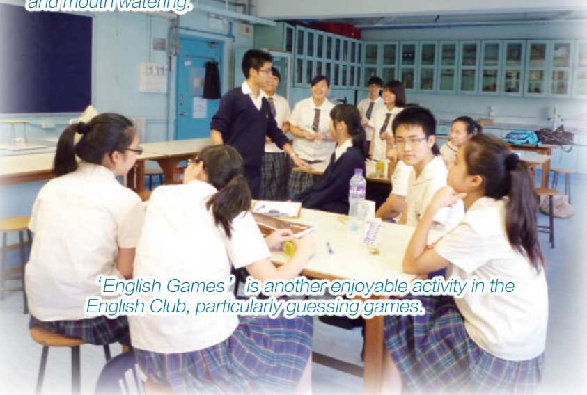
'English Games' is another enjoyable activity in the English Club, particularly guessing games.

There were also 'English Songs', Christmas and Valentine's Parties and another firm favourite, 'The Treasure Hunt'. The Committee did an excellent job ensuring the English Club members would have fun times with English every meeting.