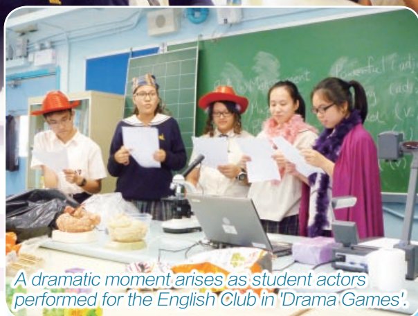
A dramatic moment arises as student actors performed for the English Club in 'Drama Games'.

The most popular activities were held again this year in the English Club, but the experience is always different as the new Form 5 Committee members devise their own tasks and games, guided by the teachers.