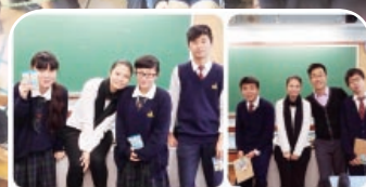
We Are Awesome!