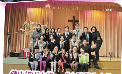
健康校園大使—「心晴學生大使培訓計劃」