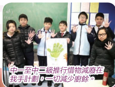
中一至中三級推行惜物減廢在我手計劃，一切減少廚餘。