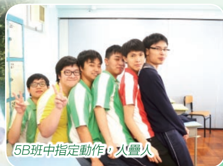
5B班中指定動作，人疊人