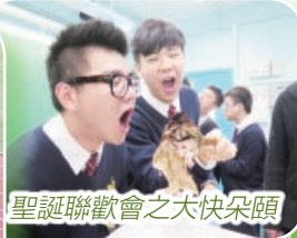
聖誕聯歡會之大快朵頤