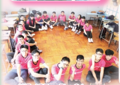
WE ARE ~ Five C!