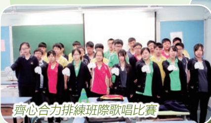
齊心合力排練班際歌唱比賽