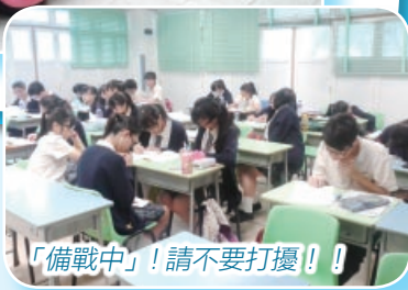
「備戰中」!請不要打擾!!