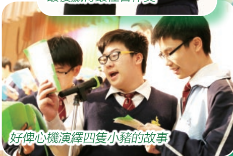
好俾心機演繹四隻小豬的故事