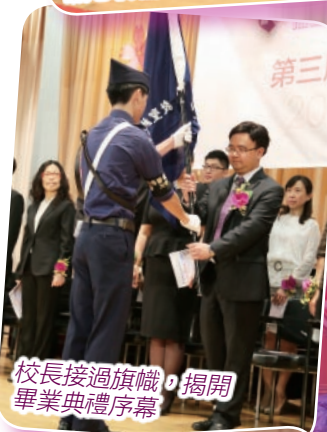
校長接過旗幟，揭開畢業典禮序幕