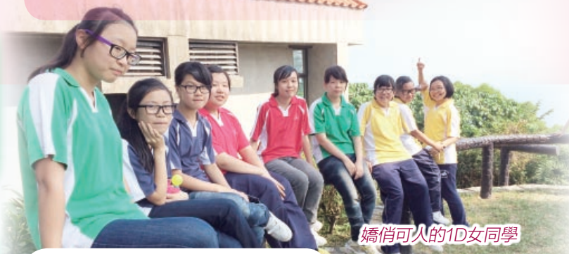
嬌俏可人的1D女同學