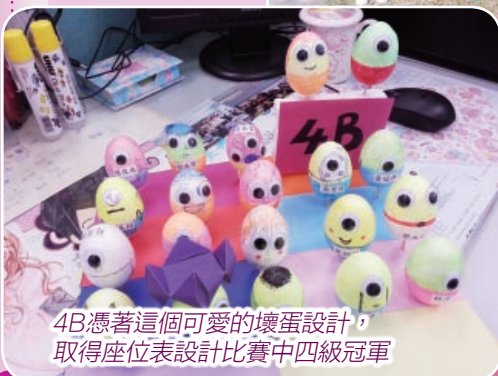
4B憑著這個可愛的壞蛋設計，取得座位表設計比賽中四級冠軍