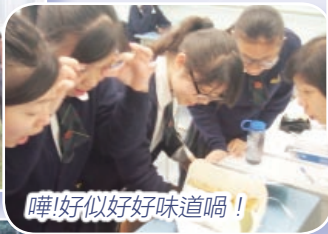
嘩!好似好好味道喎!