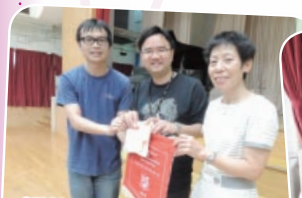
退修日邀請前任培敦中學副校長到校分享生命教育的心得

生命教育計劃是從日常生活中，觸動學生，引領他們認識生命和尊重生命，讓學生了解生命、欣賞生命、學會感恩，感謝主耶穌賜予生命，在世上有份為主作工，貢獻綿力。透過該計劃把良好的生命素質滲透給學生，培養他們具備篤實的正面價值觀。在學生成長的過程中能珍惜和尊重生命的尊嚴，並培養生存能力和抗逆能力。在群體中，學生能共同追求豐富、精彩的人生，建立樂觀的態度面對人生不同階段的挑戰。該計劃的長遠目標是發展有系統和分階段在全校推廣生命教育，現階段先以初中為主。