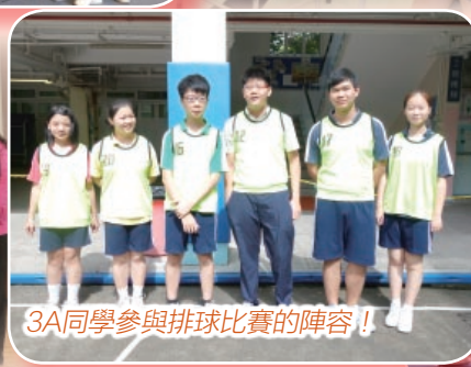
3A同學參與排球比賽的陣容!