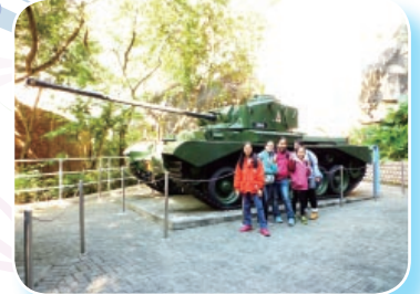
Here, Junior Ambassadors are at Lei Yue Mun Fort and in front of a tank at the entrance of the Coastal Defence Museum.

The main focus for the Junior English Ambassadors was on outings, including the completion of worksheets for these for Campus TV or assembly. They also had to complete one external competition entry, which was Clipit, the NET Section of EDB external film competition. They subsequently won a Merit award in the Clipit competition.