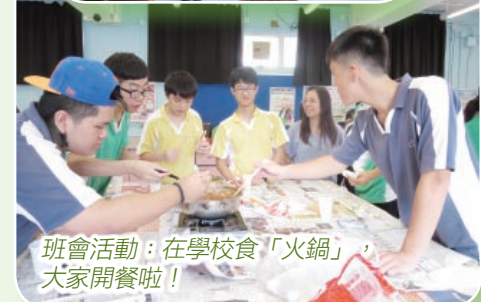
班會活動：在學校食「火鍋」，大家開餐啦！