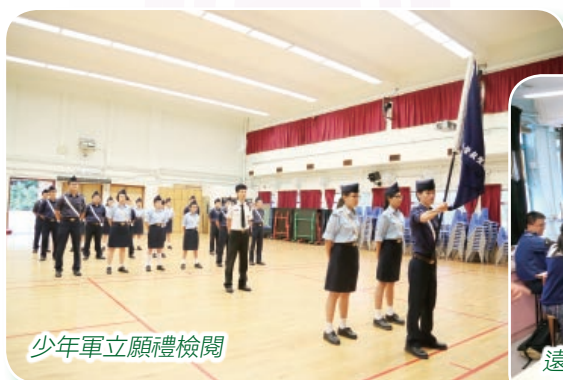
少年軍立願禮檢閱