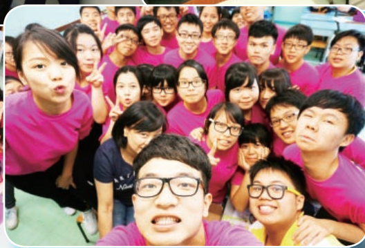
多鬼馬，唔知好騷定好笑！