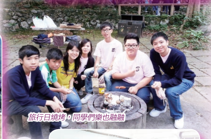
旅行日燒烤，同學們樂也融融