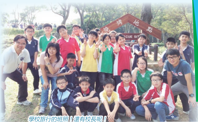
學校旅行的班照！還有校長呢！