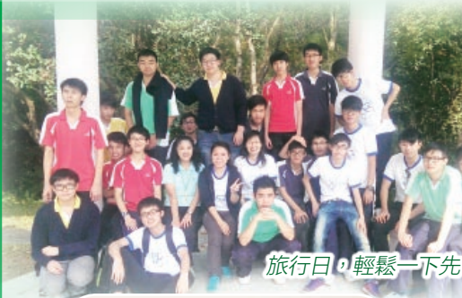
旅行日，輕鬆一下先