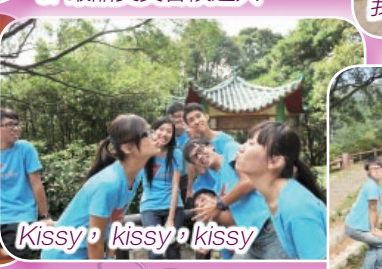
Kissy, kissy, kissy