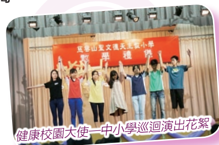
健康校園大使—中小學巡迴演出花絮

推展上述計劃是希望學員將所學各種知識及技巧，在校園內協助學校推行活動，在家庭、學校及社區裏幫助同輩及接納自己的特質，全方位發揮自己的潛能，透過「人與自己」、「人與他人」、「人與社會」三個演繹階段，以「愛自己、愛別人、愛校園、愛社區」四個發展為重點。