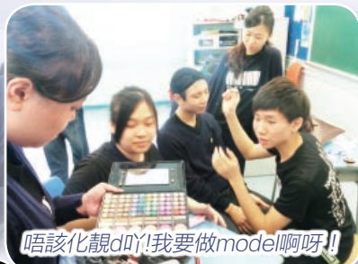
唔該化靚d呀!我要做model啊呀!