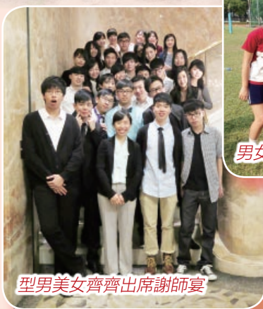
型男美女齊齊出席謝師宴