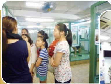
The Junior Ambassadors found their visit to the SPCA enlightening. They particularly enjoyed visiting the animals.