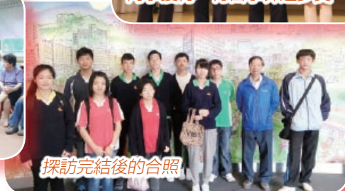
探訪完結後的合照