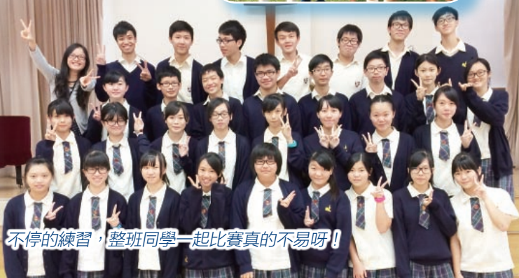
不停的練習，整班同學一起比賽真的不易呀!