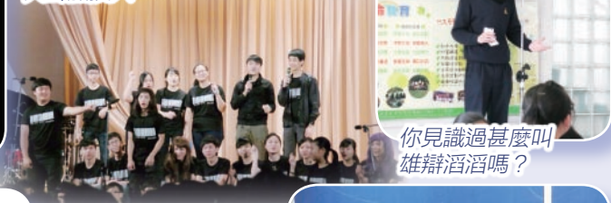
你見識過甚麼叫雄辯滔滔嗎?