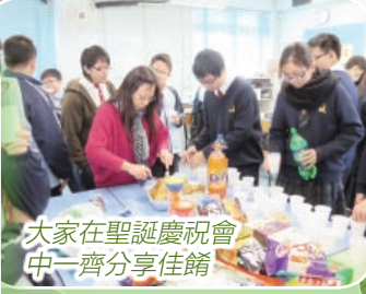
大家在聖誕慶祝會中一齊分享佳餚