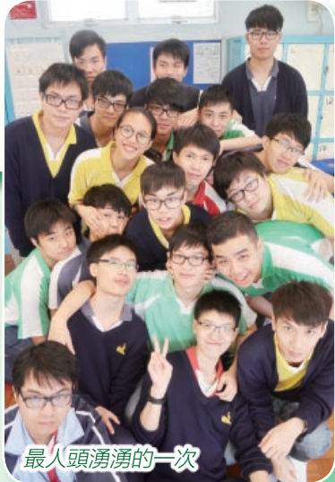
最人頭湧湧的一次