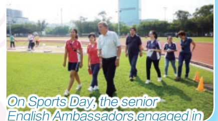
On Sports Day, the senior English Ambassadors engaged in conversation with the Norwegian visitors during the tour, and explained everything, e.g. the sports held, all about the houses and the cheerleading teams.