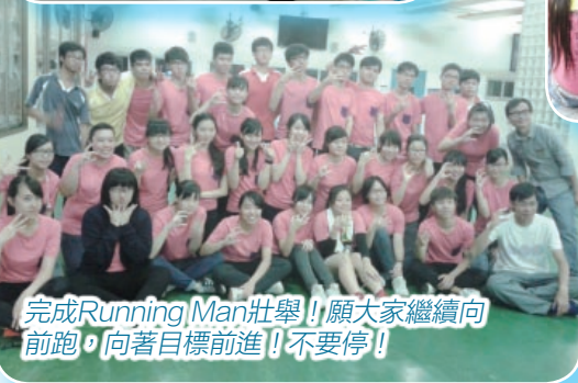
完成Running Man壯舉!願大家繼續向前跑,向著目標前進!!不要停!!