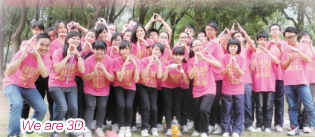
We are 3D.