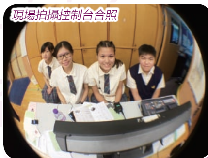
現場拍攝控制台合照