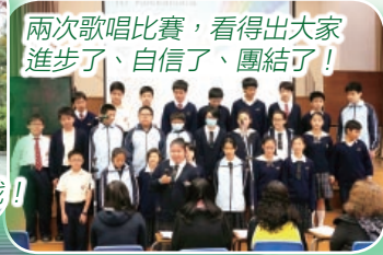
兩次歌唱比賽，看得出大家進步了、自信了、團結了！