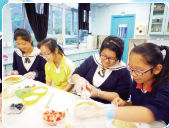
Every year, the Cooking Class competes for favourite activity for the year, and this year was no different as students prepare and decorate their pancakes.