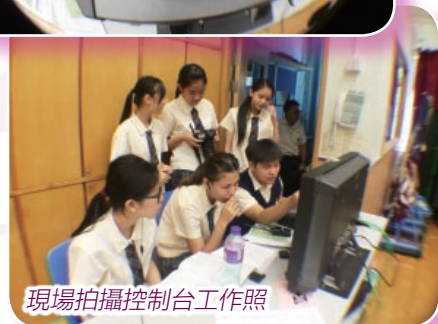
現場拍攝控制台工作照