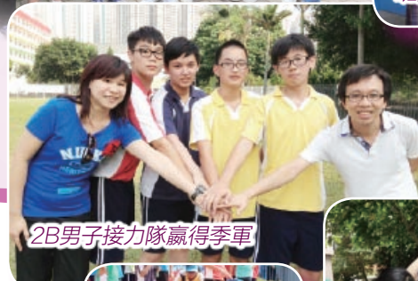
2B男子接力隊贏得季軍