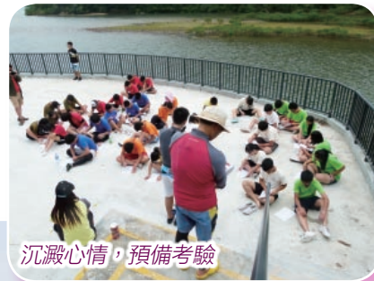
沉澱心情，預備考驗