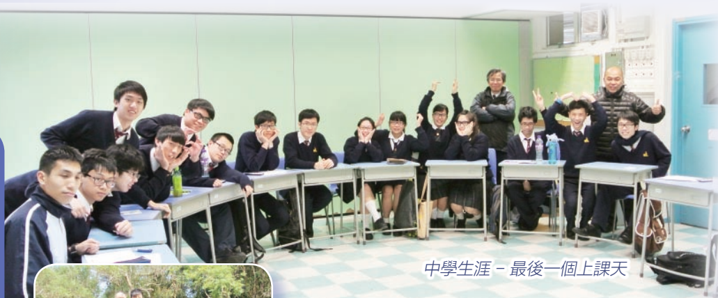
中學生涯 - 最後一個上課天

6B同學終於完成了人生的一個重要階段。他們每人都如此特別，每個人都有鮮明的個性，經三年的磨合，卻可以融合成為一個整體。當他們認定目標後，便會努力爭取，遇上沮喪，會互相鼓勵，也會為各人的成就而高興。表面上他們對前路顯得漠不關心，但在文憑試後他們各自開展自己的前途，尋找自己的理想。再次相聚，他們會有分享不盡的話題，偶有沉默，但在相望時，無限事已不在言中。