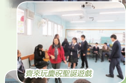
齊來玩慶祝聖誕遊戲