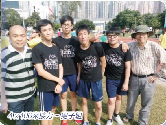
4x100米接力 - 男子組