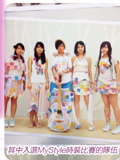
其中入選MyStyle時裝比賽的隊伍