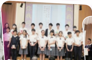
初中生命教育主題：做我真好，你我同行