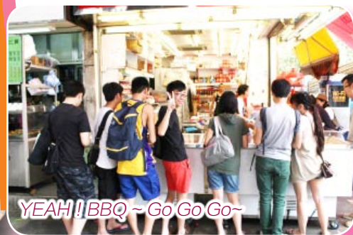
YEAH! BBQ ~ Go Go Go~