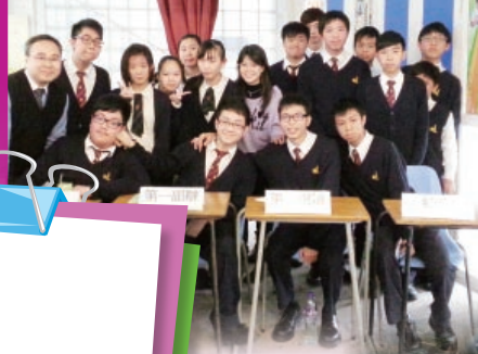
恭賀同學取得班際辯論比賽中四級亞軍