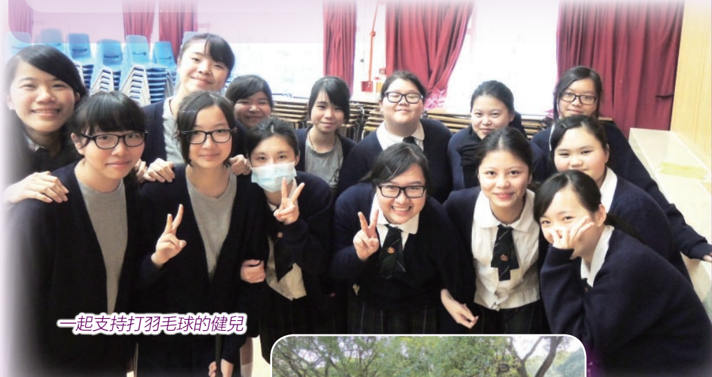
一起支持打羽毛球的健兒