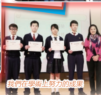
我們在學術上努力的成果