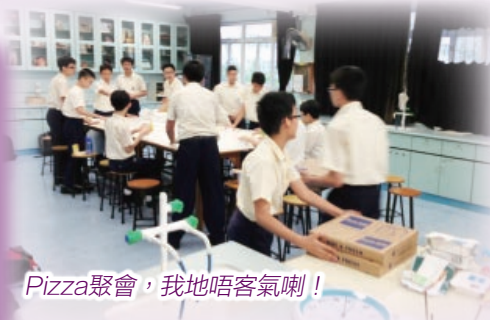
Pizza聚會，我地唔客氣喇！