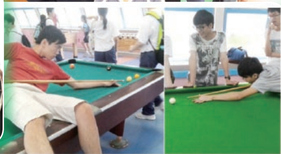
男生們都愛玩桌球