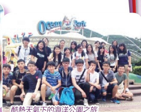
酷熱天氣下的海洋公園之旅