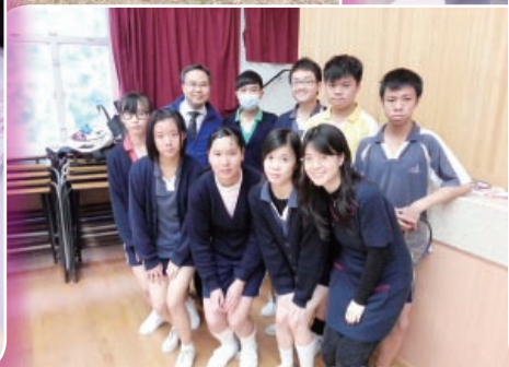
感謝同學在班際羽毛球比賽的付出