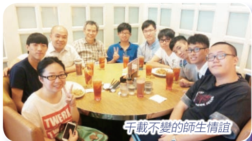
千載不變的師生情誼