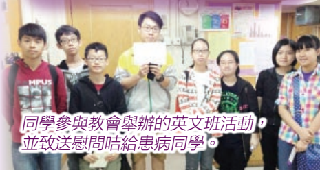
同學參與教會舉辦的英文班活動，並致送慰問咭給患病同學。