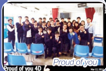
Proud of you 4D