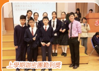
上學期迦密團勤到獎