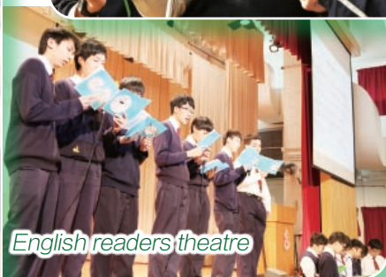
English readers theatre