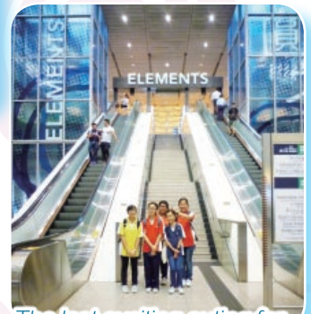
The last exciting outing for Junior Ambassadors was to see 'Transformers: Age of Extinction' at Elements.

As the outgoing NET teacher, I feel gratified that in this final year that I guided the English Ambassadors has been one of the best. This is largely thanks to the hardworking, mature and responsible attitude of the students involved in this year's English Ambassador Scheme. I wish them all well in the coming years of their schooling and future careers.