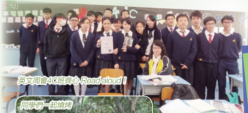
英文周會4C班齊心 Read aloud!