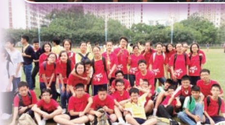
陸運會，發揮體育精神。