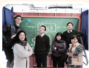
校慶BACK TO SCHOOL

過去的路，雖然崎嶇，但今天，見到同學令人欣慰的表現，蒸蒸日上的學習風氣，同學及歷屆畢業生樹立的良好榜樣，令我們深深感到勞苦所結的碩果。