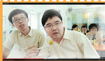
生命教育劇場——我的夢遊奇境