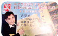
45周年特別版學生證

今年是堅樂中學的四十五周年，我們感恩四十五年來上帝的恩典豐富。回顧過去，學校校舍簡陋，資源貧乏，但學校卻有一群充滿愛心的老師，一直以捨己的精神，將優質教育帶給學生，讓學生有豐盛的生命。多年來，學校面對很多挑戰，但我們不斷經歷上帝的恩典，祂帶領學校走過不少崎嶇的道路，直到今天，上帝仍然看顧堅樂中學。