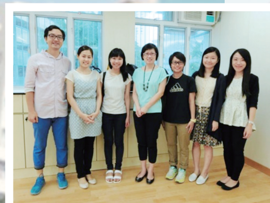
堅樂第二小學校長（中左者） 及老師合照

堅中堅小一條心，願堅中師生一同支持這事工！更願堅樂第二小學的同學升上堅中，繼續傳承堅樂精神！