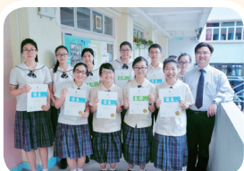
第66屆校際朗誦節獲獎