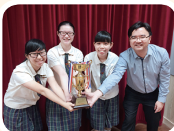
英文辯論隊兩奪冠軍寶座

今年，亦是學校走出香港，走向國際化的一年。過去，我們與內地、台灣的大學結盟，挪威的大學亦每年有學生到本校交流。今年，我們再走向國際，與加拿大的大學、韓國的大學結盟，更進一步計劃與美國的大學連繫，希望同學有更廣闊的升學出路。學校今年有來自德國的交換生就讀；明年，本校會有學生去美國、加拿大、意大利等交流學習。期望這些交流，讓同學有更多的國際視野。