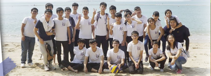
旅行日-與陽光玩遊戲