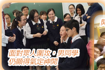
面對眾人圍攻，男同學仍顯得氣定神閒