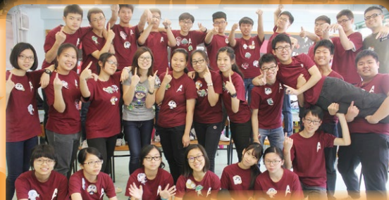
中五班際攝影比賽