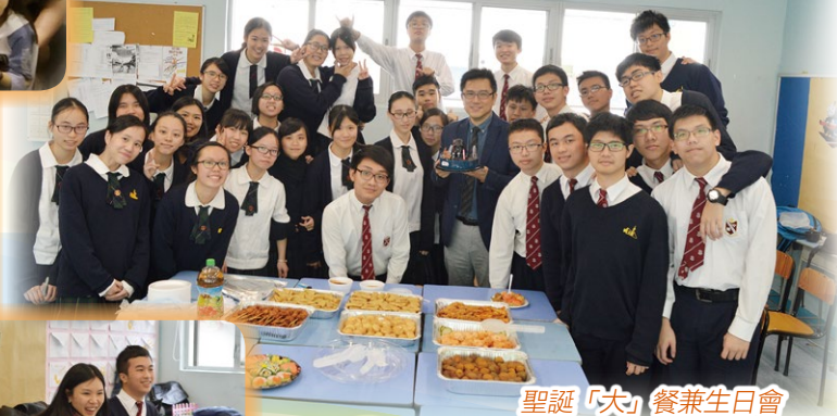
聖誕「大」餐兼生日會