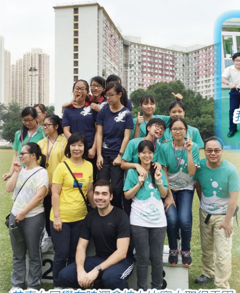
恭喜女同學在陸運會接力比賽中取得季軍