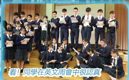
看! 同學在英文周會中很認真