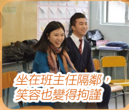
坐在班主任隔鄰，笑容也變得拘謹