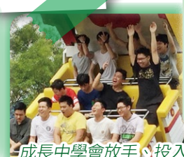
成長中學會放手、投入