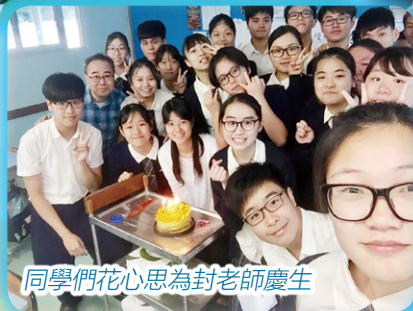
同學們花心思為封老師慶生