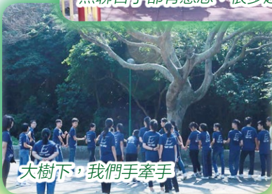
大樹下，我們手牽手