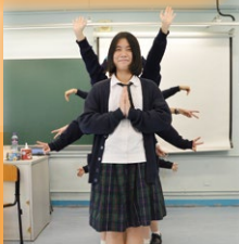
穿崩了!後面同學沒有收好自己的腳