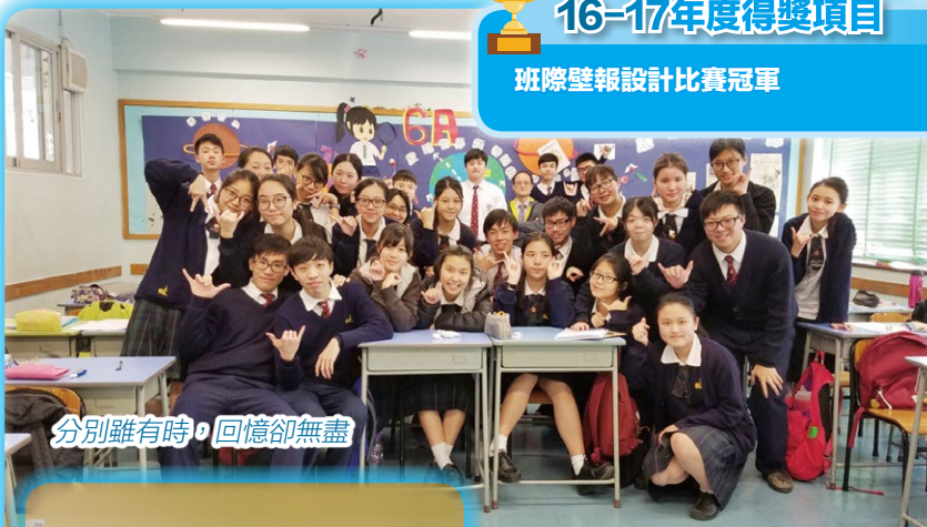
分別雖有時，回憶卻無盡