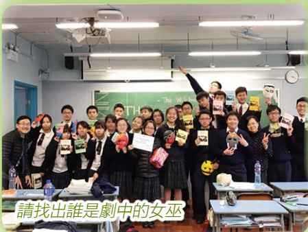
請找出誰是劇中的女巫