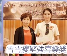
雪雪獲堅強喜樂獎