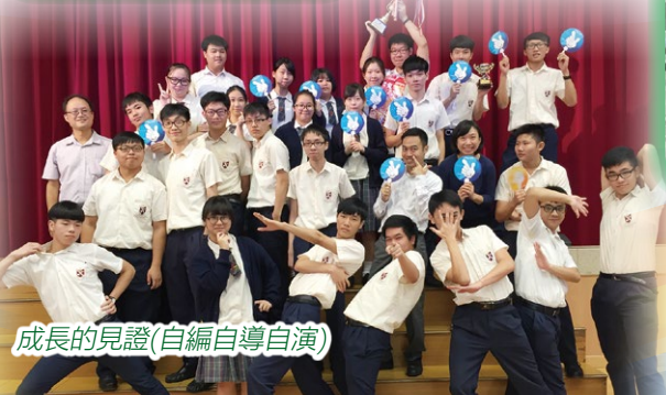
成長的見證(自編自導自演)