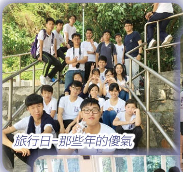
旅行日-那些年的傻氣