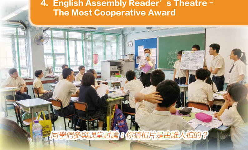
同學們參與課堂討論：你猜相片是由誰人拍的？