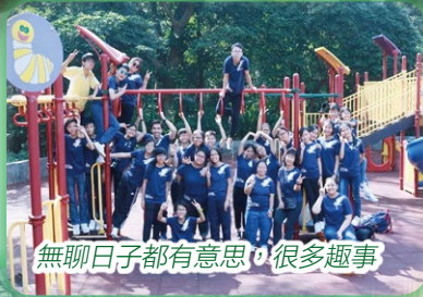
無聊日子都有意思，很多趣事