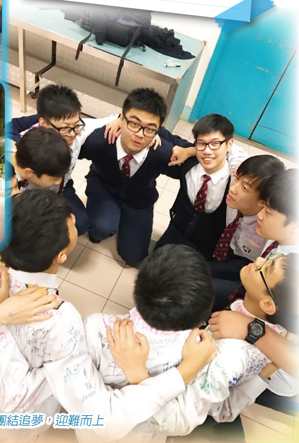
團結追夢，迎難而上