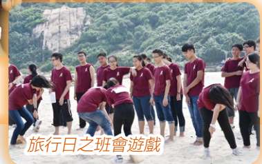
旅行日之班會遊戲