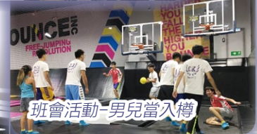
班會活動-男兒當入樽