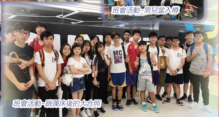
班會活動-跳彈床後的大合照