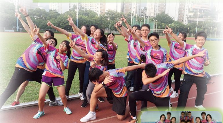
I believe I can fly! 朝夢想啟航吧!