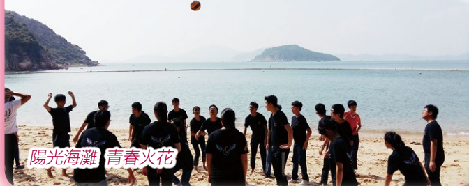
陽光海灘 青春火花