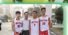
為何沒有班際籃球賽?