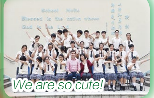
We are so cute!