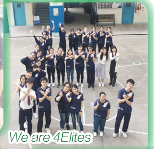
We are 4Elites