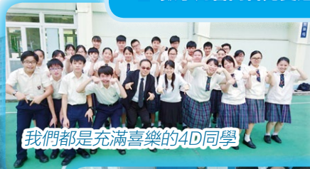
我們都是充滿喜樂的4D同學