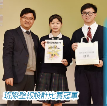
班際壁報設計比賽冠軍

人生是沒有確實的地圖，或許面對抉擇，你們會惶恐、緊張，但你們可以回望這六年來在堅樂中獲得的心靈資產，包括感恩、平安、勇敢及靠著神的應許在未來的日子，繼續堅定前行，做個「堅樂人」。READY?