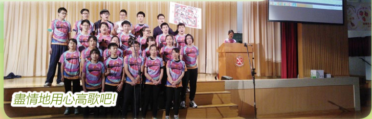
盡情地用心高歌吧!