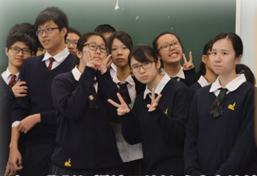
女同學對相機鏡頭的敏感度真的特別高