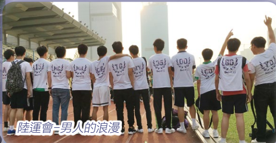
陸運會-男人的浪漫