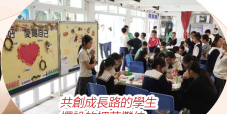
共創成長路的學生擺設的押花攤位