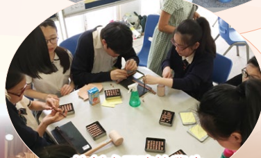
共創成長路的學生籌組的皮革製作攤位