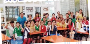
女子籃球校隊聯歡會