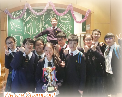
We are Champion!