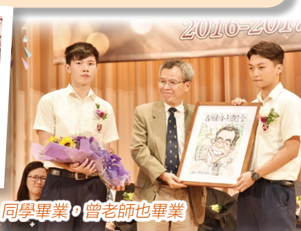
同學畢業，曾老師也畢業