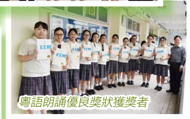
粵語朗誦優良獎狀獲獎者