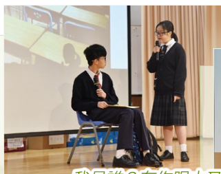
我是誰？在你眼中又是誰？