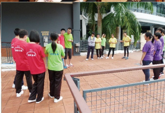
初中學生領袖訓練日營