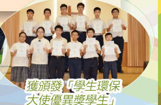
獲頒發「學生環保大使優異獎學生」