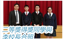
三等獎得獎同學與李校長合照

是次比賽旨在引發學生學習數學的興趣，激發對數學競賽活動之熱情，擴闊學術視野，促進數學學術交流。盼望同學能在日後的數學比賽中取得更佳成績，為校爭光。