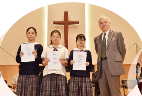
香港青年協會舉辦的Power Up 發放校園正能量計劃優秀表現獎