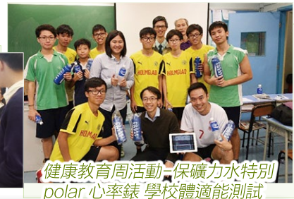
健康教育周活動-保礦力水特別 polar 心率錶 學校體適能測試