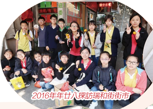
2016年年廿八探訪瑞和街街市