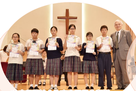
家庭與學校合作事宜委員會舉辦「快樂的我」獎勵計劃2017嘉許證