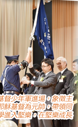
基督少年軍進場，象徵主耶穌基督為元帥，帶領同學進入堅樂，在堅樂成長