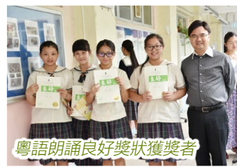
粵語朗誦良好獎狀獲獎者