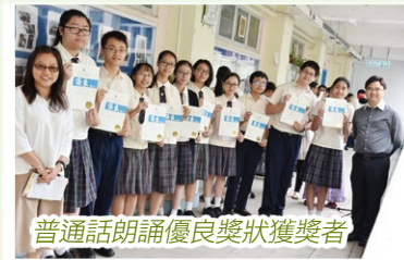
普通話朗誦優良獎狀獲獎者