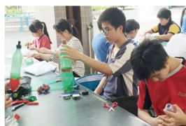
同學即場製作參賽的水火箭