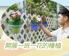
開展一班一花的種植