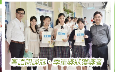
粵語朗誦冠、季軍獎狀獲獎者