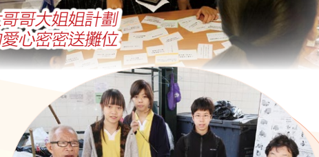
生活體驗，關懷觀塘社區