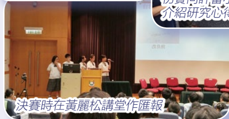
決賽時在黃麗松講堂作匯報