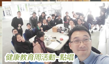
健康教育周活動-點唱