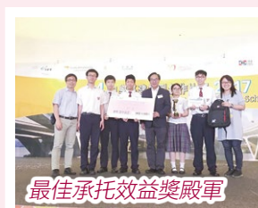
最佳承托效益獎殿軍