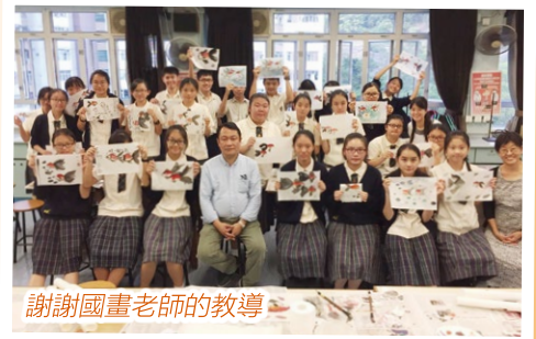
謝謝國畫老師的教導