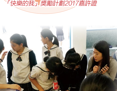
大哥哥大姐姐計劃的愛心密密送攤位