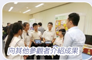
向其他參觀者介紹成果