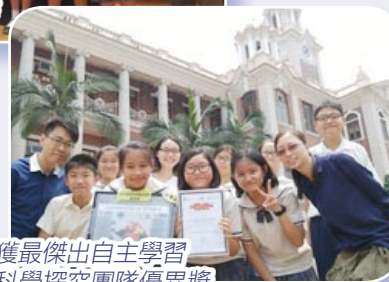
獲最傑出自主學習科學探究團隊優異獎