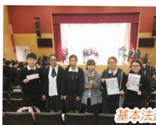
基本法盃九龍區季軍