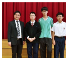
銀獎得主與李校長合照

是次比賽旨在引發學生學習數學的興趣，激發對數學競賽活動之熱情，擴闊學術視野，促進數學學術交流。盼望同學能在日後的數學比賽中取得更佳成績，為校爭光。