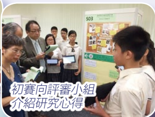
初賽向評審小組介紹研究心得