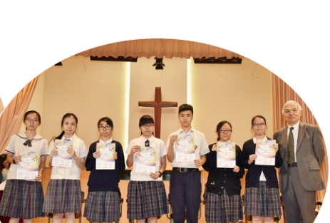
香港家庭與學校合作事宜委員會舉辦「快樂的我」獎勵計劃2017嘉許證