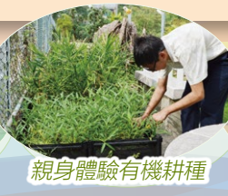
親身體驗有機耕種