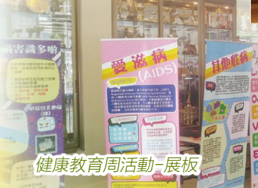
健康教育周活動-展板