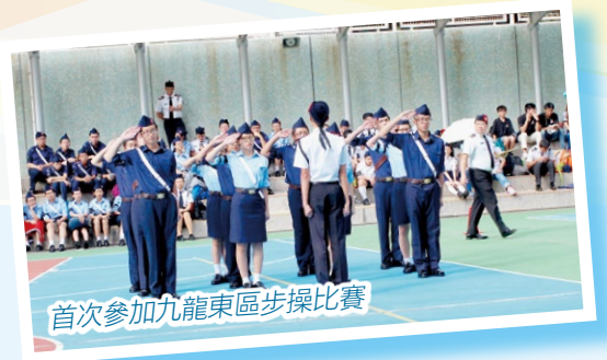
首次參加九龍東區步操比賽

少年軍藉著獎章活動及各項服務，以培訓少年人的服從、虔誠、紀律及自愛等良好行為，以成基督化的人格。