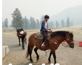
It was an amazing experience during horseback riding. We look cool, don't we?