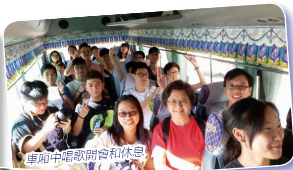
車廂中唱歌開會和休息