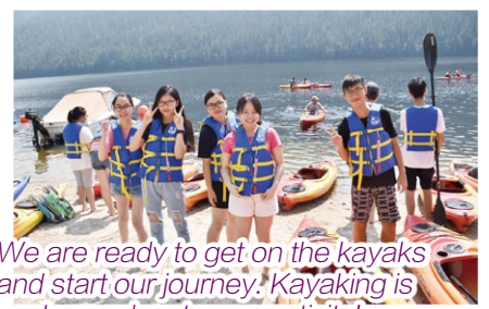
We are ready to get on the kayaks and start our journey. Kayaking is such an adventurous activity!

Nine students participated in a 15-day programme which was called Canada Culture & English Summer Camp organized by CCCEA. They had English lessons at TRU (Thompson Rivers University) and various activities in Kamloops such as horseback riding, kayaking and rock climbing and so on. They stayed in different host families experiencing the Canadian cultures which made this trip fruitful and memorable.