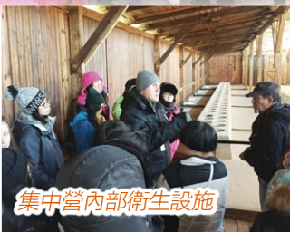
集中營內部衛生設施