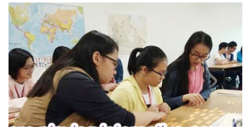
We are playing interactive games in the lessons and practicing our listening and speaking skills.