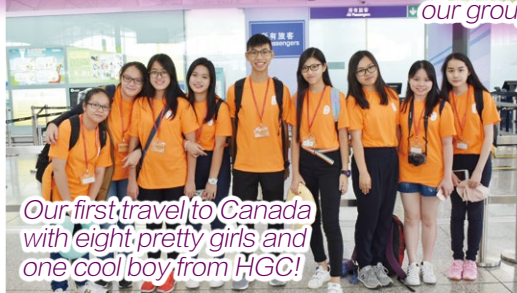
Our first travel to Canada with eight pretty girls and one cool boy from HGC!