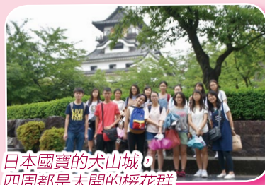
日本國寶的犬山城，四周都是未開的櫻花群