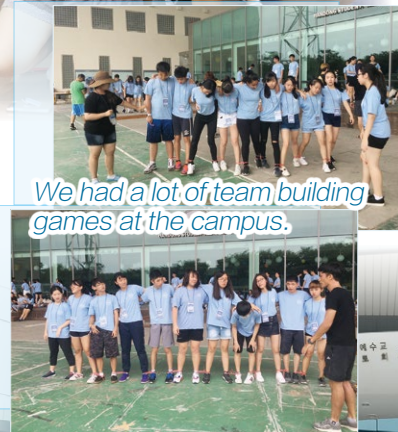
We had a lot of team building games at the campus.