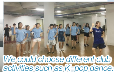
We could choose different club activities such as K-pop dance.