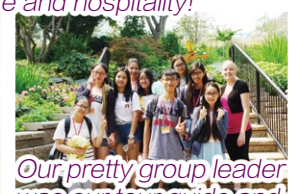
Our pretty group leader was our tour guide and introduced different places to us.