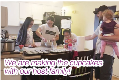
We are making the cupcakes with our host family!