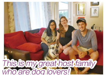
This is my great host family who are dog lovers!