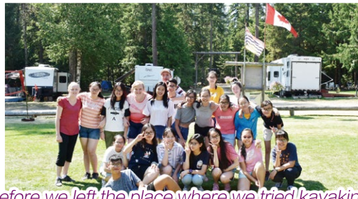
Before we left the place where we tried kayaking, our group had taken a photo together.