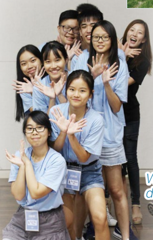
We made a lot of new friends from different schools and countries.