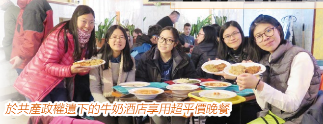
於共產政權遺下的牛奶酒店享用超平價晚餐