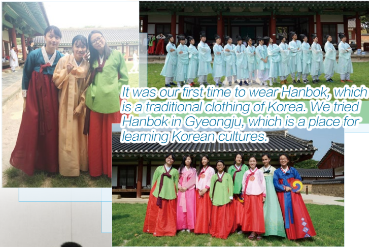
It was our first time to wear Hanbok, which is a traditional clothing of Korea. We tried Hanbok in Gyeongju, which is a place for learning Korean cultures.

From 15th-24th July, ten students participated in an unforgettable programme which was called Global Leadership Programme. This programme was organized by Handong Global University. They planned a lot of activities for us, including Korean language classes, lectures, cultural experience, etc. The staff and group leaders were friendly and caring and they were responsible for taking care of us for these ten days.