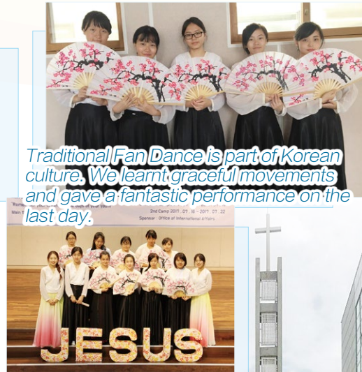
Traditional Fan Dance is part of Korean culture. We learnt graceful movements and gave a fantastic performance on the last day.