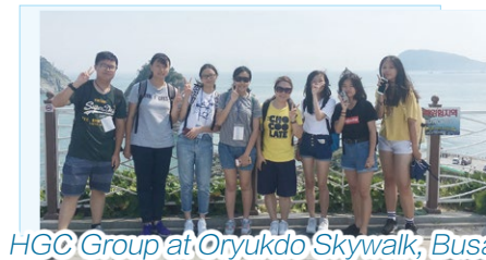
HGC Group at Oryukdo Skywalk, Busan