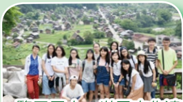
一覽眾屋小，世界文化遺產的白川鄉

在第二天，我們在犬山遊園站出發去犬山城，本來需要十分鐘的路程，我們走了一小時，再次回到犬山遊園站的時候才後悔自己沒有看地圖和路標。我們去了犬山城，了解古代日本人的智慧，城堡興建在山頂、背河，超高梯級，以防被入侵，高居臨下，一覽無遺。然後，我們去了Legoland，是Lego迷勝地，帶給樂樂童真回憶。