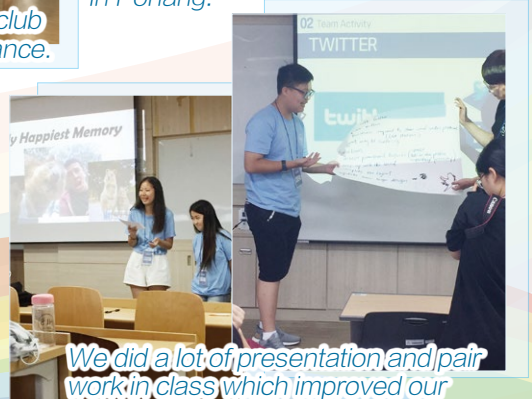
We did a lot of presentation and pair work in class which improved our confidence and cooperation skills.