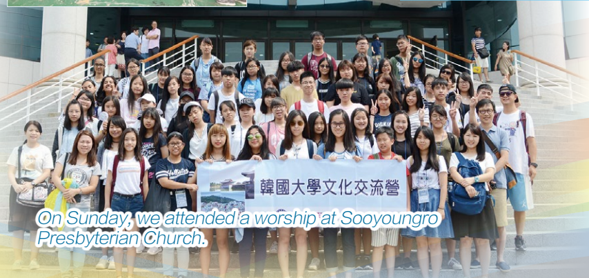
On Sunday, we attended a worship at Sooyoungro Presbyterian Church.