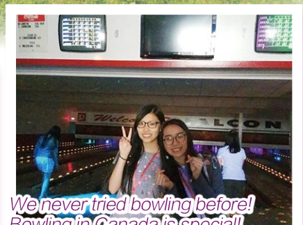
We never tried bowling before! Bowling in Canada is special! They have five pins only.