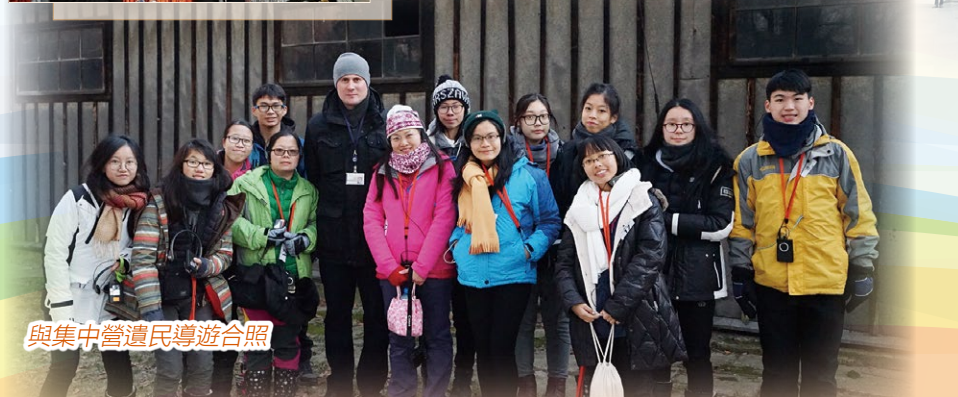
與集中營遺民導遊合照