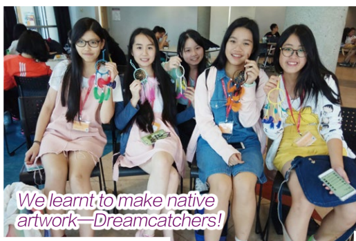
We learnt to make native artwork—Dreamcatchers!