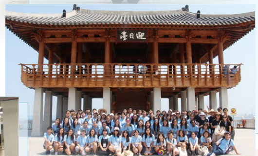
We visited Yeongildae Beach in Pohang.