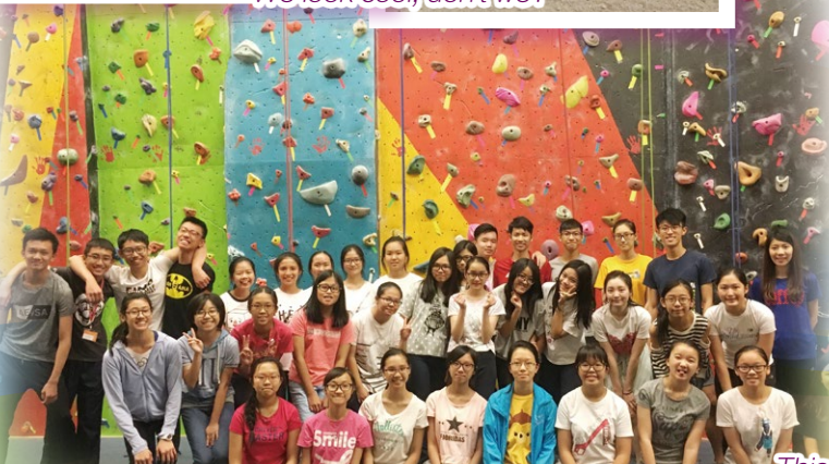
We had a competition during the indoor rock climbing. Luckily, our group won!