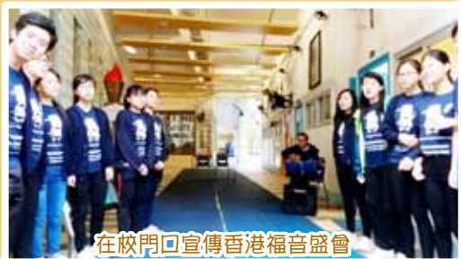
在校門口宣傳香港福音盛會

於2017年12月22日（五）學校舉行聖誕崇拜，為讓學生學習關心有需要的人，學習效法耶穌基督的榜樣，故在當日舉行慈善籌款日，共籌得港幣2610元，善款轉交「香港世界宣明會」，援助貧窮社羣。當天崇拜由同心圓青年敬拜平台同工帶領詩歌及分享信息，主題是不一樣的生命。