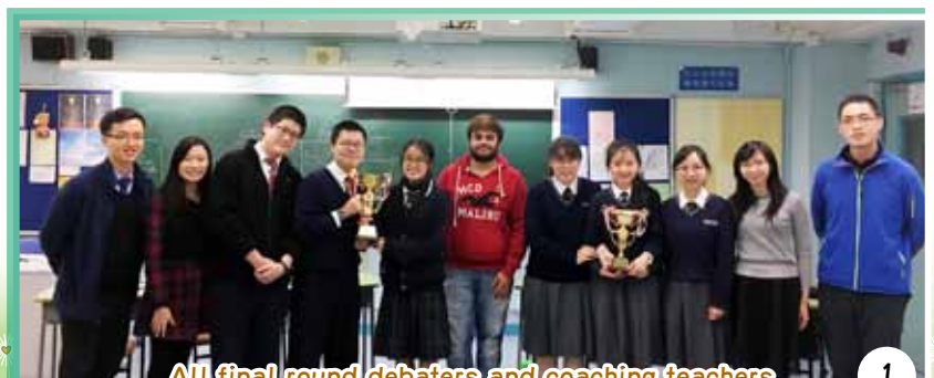
All final round debaters and coaching teachers