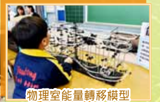
物理室能量轉移模型