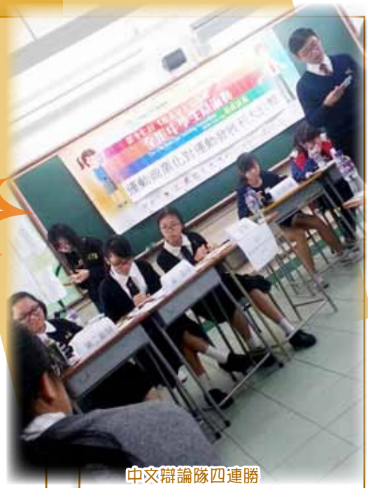
中文辯論隊四連勝