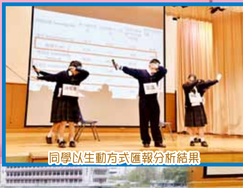
同學以生動方式匯報分析結果