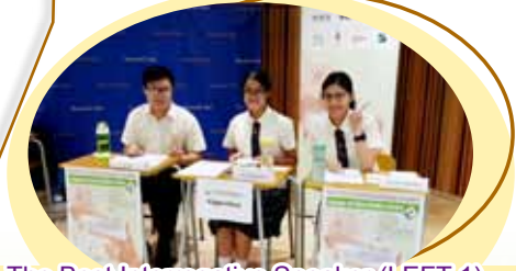
The Best Interrogative Speaker (LEFT 1)