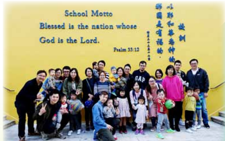
畢業生於校友日帶同子女回校感謝老師，亦讓子女認識自己成長的地方

做一個感恩的人或做一個抱怨的人，是我們自己的選擇。同學們，你選擇做一個怎樣的人呢？現代的研究告訴我們，懂得感恩的人更快樂、更健康、更有滿足感。同學們，讓我們學習懷感恩的心，做感恩的人，今天就向身邊的人表達感謝！