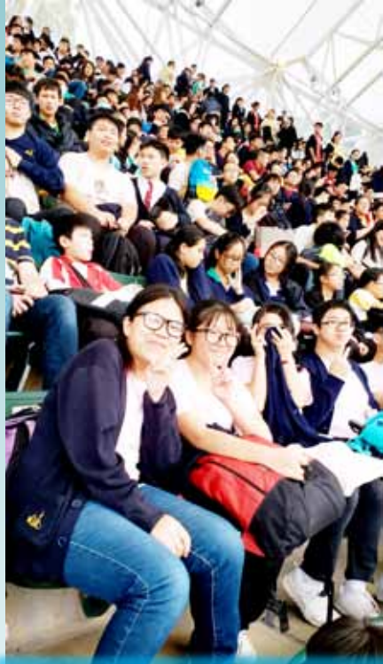
前往香港福音盛會會場