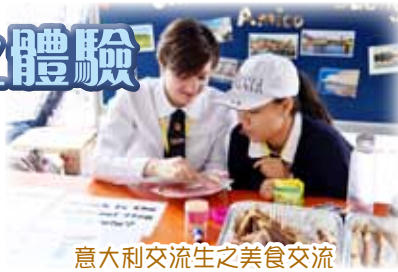
意大利交流生之美食交流

2017年11月25日(六)早上為我校首次舉辦的資訊日，當日內容豐富包括、課程簡介、入學須知、學科展覽、攤位遊戲、科學實驗。區內數百名小學生及家長到校參觀，親身了解我校辦學理念及設施，為升中選擇作準備。