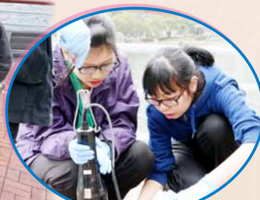
利用科學儀器分析水樣本