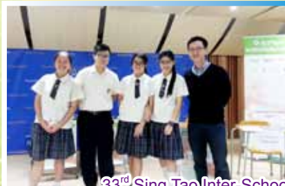
33 rd Sing Tao Inter-School Debating Competition