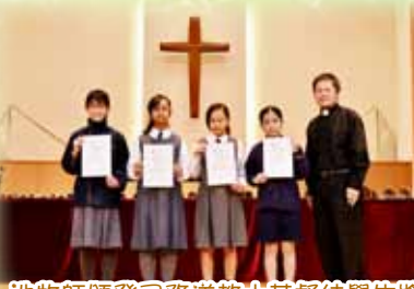
池牧師頒發司務道教士基督徒學生獎