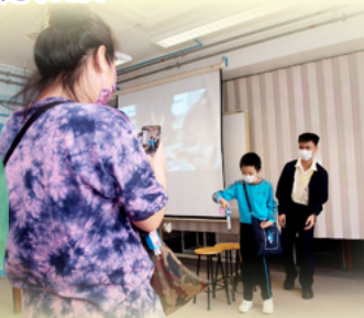
堅樂小學學生及家長 一同體驗懸浮的魔法