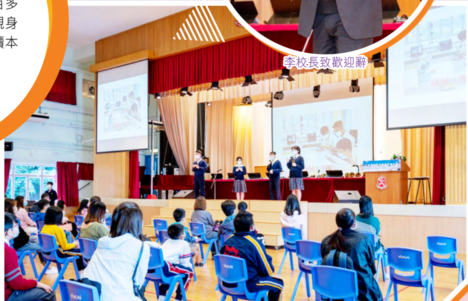
學生代表分享校園生活