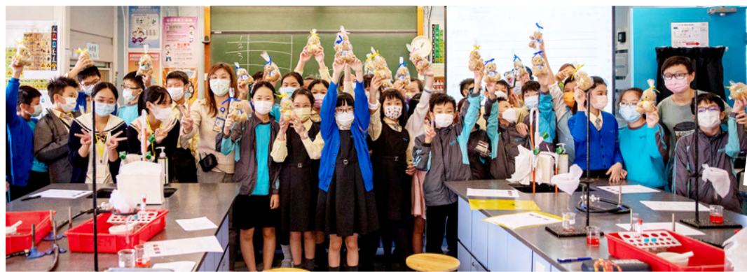
堅樂小學科學體驗課