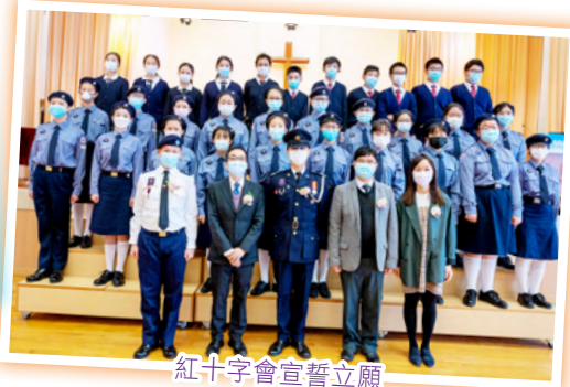
紅十字會宣誓立願