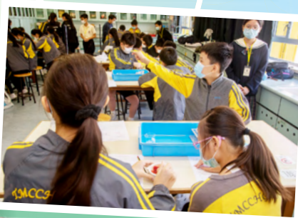
堅樂第二小學科學體驗課