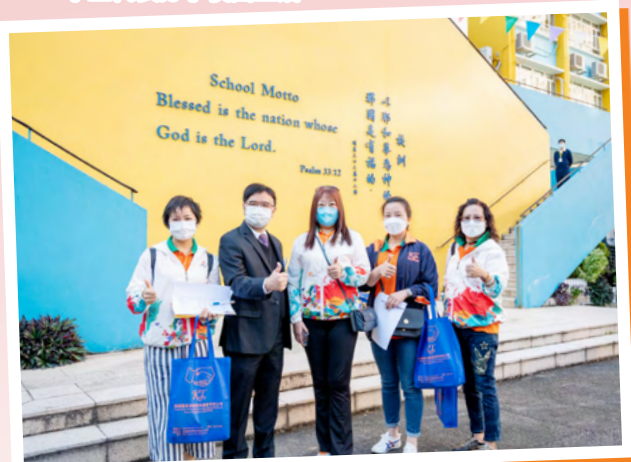
李校長與家長領隊合照