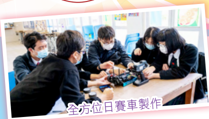
全方位日賽車製作