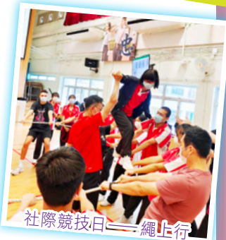
社際競技日——繩上行