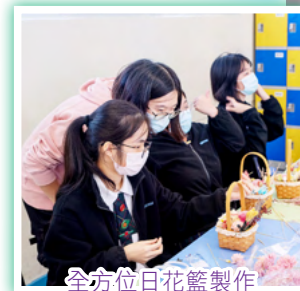
全方位日花籃製作