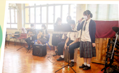
Live Band Show