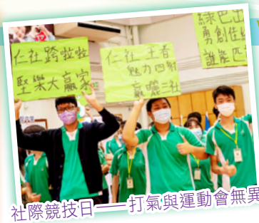
社際競技日——打氣與運動會無異