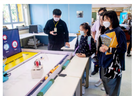
機械人取球及射球比賽