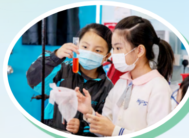
堅樂小學同學提取士多啤梨基因