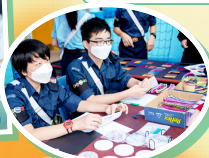
基督少年軍281分隊巧手小作