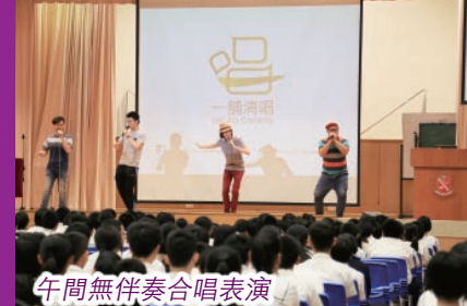
午間無伴奏合唱表演