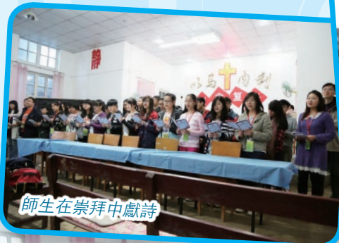
師生在崇拜中獻詩

這次旅程當中，我除了在屬靈上有了轉變，而且對於中國的歷史文化有了更深的認識。以前我總以為自己比較認識中國歷史，但在這次旅程當中，我聽到更多歷史中的細節，例如有關大地原點、兵馬俑的背後小故事，這都是我以往學歷史所不留意細微末節。而鄭國渠遺址，更令我感慨古人的無限智慧，兩千多年已經擁有現代的科學技術，由此看來，如果再以聰明人自詡，便顯得可笑了。