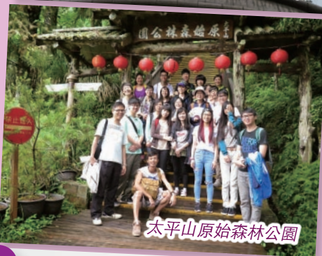
太平山原始森林公園