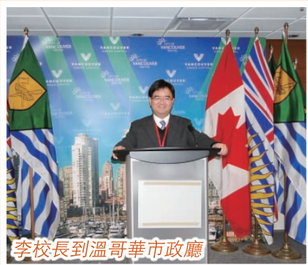
李校長到溫哥華市政廳

自新學制開始，本校師生不斷努力在學生品格、信仰、學與教方面建立學生。過去幾年，學生的生命成長令我們感到欣喜，學生在公開試的表現也持續進步，入讀本地大學的人數持續上升，成果令人鼓舞。