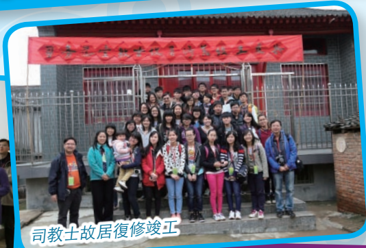
司教士故居復修竣工